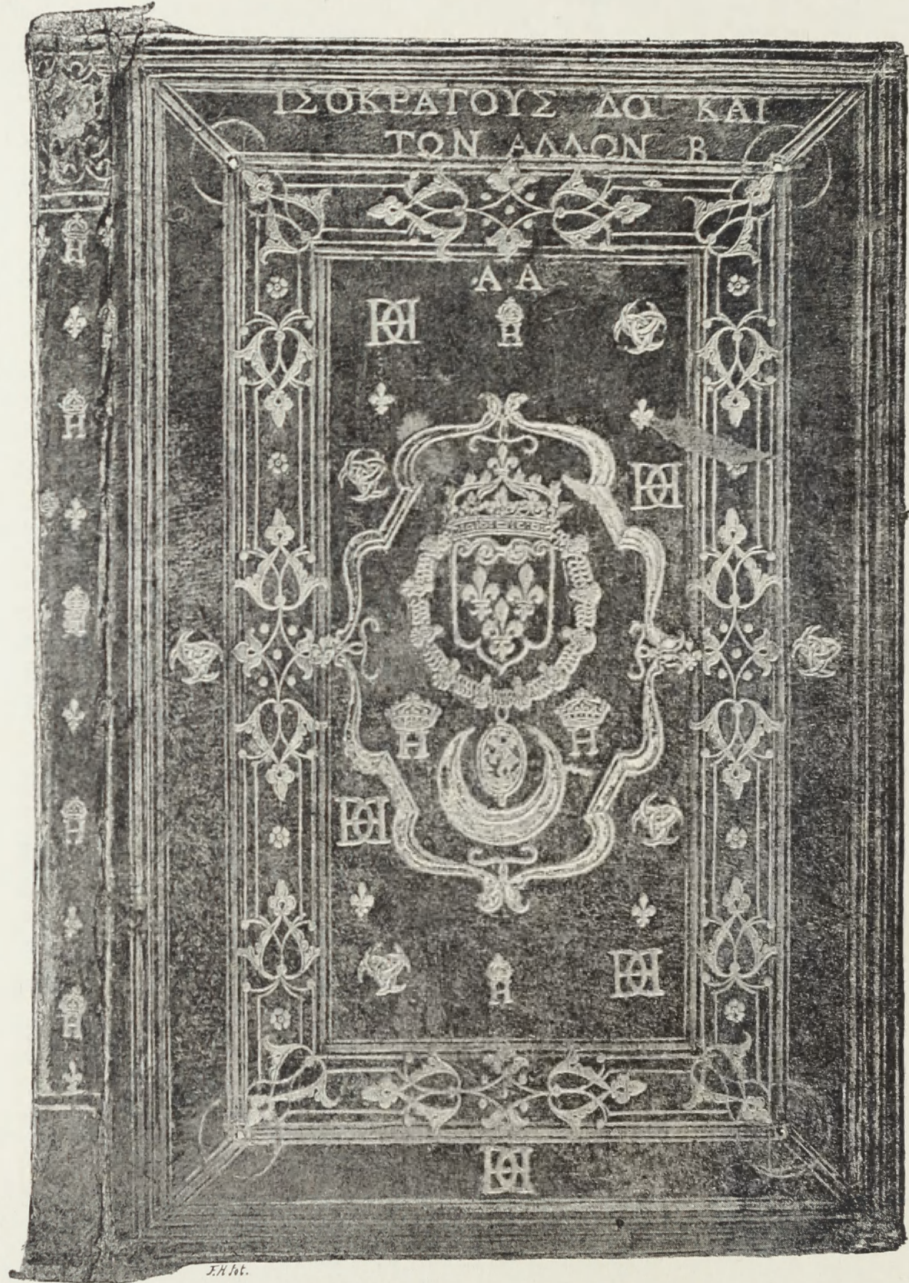
Isocrates. Venetiis 1534. Med Henrik II's Mærke. (Tilhører det store kgl. Bibliothek.)

ner ere skraat afskaarne, og her er indlagt Stykker af rødbruunt Skind med et temmelig stort Ornament i Blindtryk. Midt paa Bindet er anbragt Eier-