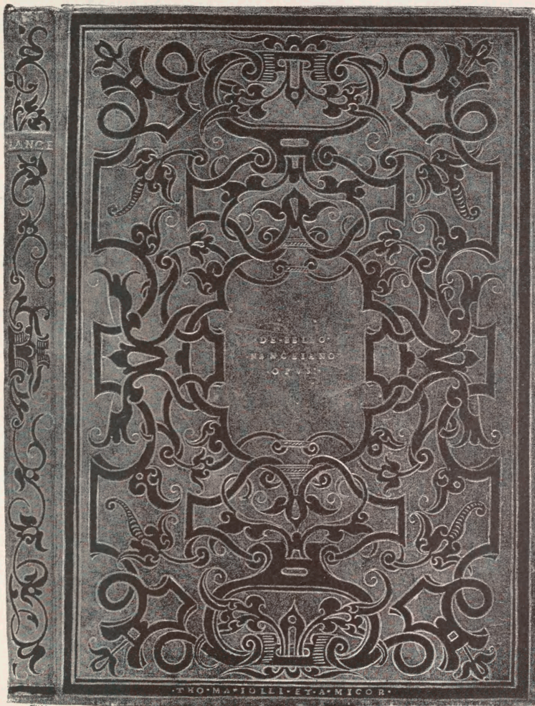
Petri de Blarriorivo insigne Nanceidos Opus. 1518. Th. Maiolis Eksemplar. (Tilh. d. st. kgl. Bibliothek.)