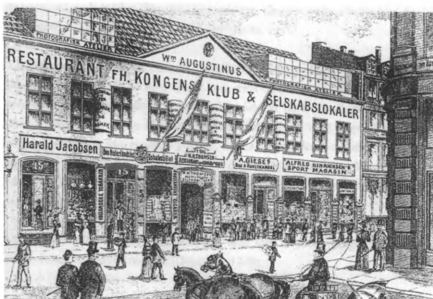
Karl van Manders gård, Østergade nr. 15, ca. 1890.

udvikling. Dansk Kvindesamfund blev stiftet i 1871, bl.a. med det formål 'at hæve kvinden i åndelig, sædelig og økonomisk henseende'. 9 En Handelsskole for Kvinder blev oprettet i 1873, men nedlagt igen allerede i 1890, da man mente at Studentersamfundets aftenundervisning tog sig af samme opgave.