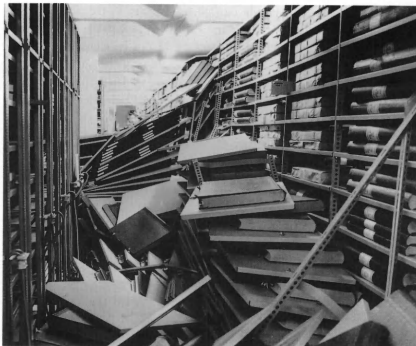
22. februar 1983: Uheldet er ude. En kompaktreol i den nye aviskælder væltede og rev i faldet tre andre reoler med. Ingen personer kom til skade, og avisbindene klarede det også uden »varige men«. Uheldet skyldtes en fejlmontering i den reol der væltede.

sen var efterhånden blevet kneben, og nye magasiner til aviserne indgik derfor i planerne for bibliotekets nye bygning. Afgørende for flytningen var imidlertid, at man ønskede at opbevare aviserne under bedre forhold. Magasinet i den gamle kasernebygning var som nævnt uden opvarmingsmulighed, og arbejdsrum og læsestue blev opvarmet af en kakkelovn.