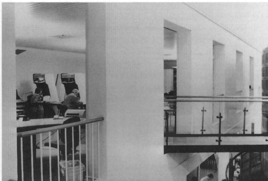
Statsbibliotekets avislæsesal 1994. Aviser er et meget benyttet materiale, og ved bibliotekets ombygning 1993-94 blev der indrettet en helt ny avislæsesal centralt i biblioteket.

bedste måde at sikre aviserne for fremtiden. Filmene har vist sig holdbare – uden at man dog kender grænserne for holdbarheden. Men filmene har begrænsninger. Reproduktion af avisbilleder og visse typer presseforskning (bl. a. med opmåling som metode) kræver brug af originalaviserne. Man kan derfor ikke forestille sig, at Statens Avissamling ender som en ren mikrofilmsamling!