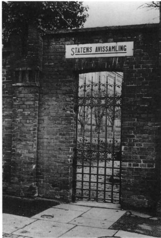
Statens Avissamling var fra starten ikke nogen imponant institution. Her ses den beskedne indgang fra Høegh Guldbergsgade, hvor samlingen havde til huse 1916-64.