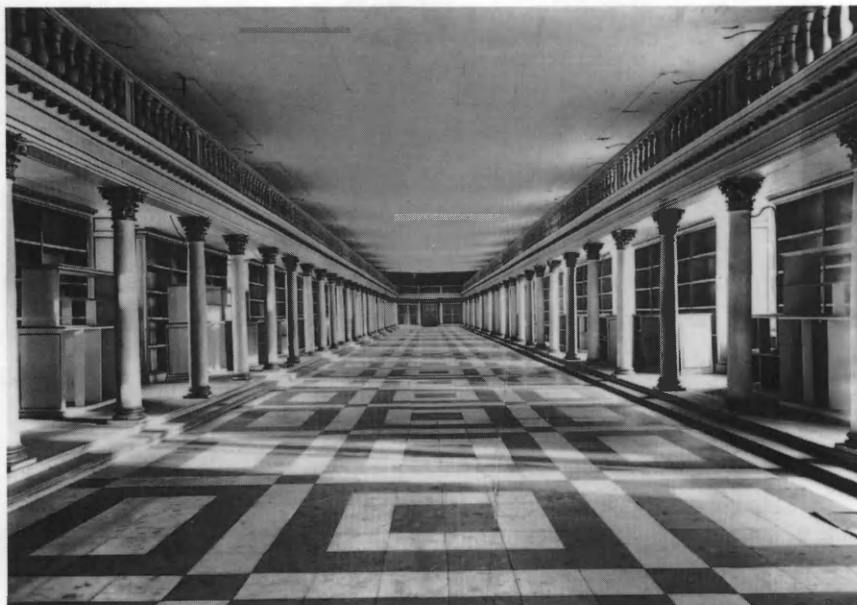
Bibliotekssalen målte ca. 80 m i længden og 12 m i bredden. Søjlerne, der bar det omløbende galleri, var oprindelig malet skiftevis i rødbrune og grågrønne marmoreringer. Foto fra 1906, efter at biblioteket var flyttet til den nuværende bygning og kort før salen blev ombygget til brug for Rigsarkivet.

påtvunget Hojer som en yngre og energisk vicebibliotekar, der skulle rette op på forholdene. Det første resultat blev den af bibliotekskommissionen udarbejdede katalog over hovedbestanden samt revisionen af den foreliggende Reitzer-katalog, begge foretagender udført med en vis hast i løbet af sommer og efterår 1729 – i vinterhalvåret havde ingen lyst til at arbejde i den uopvarmede bibliotekssal. Kommissionen var blevet udpeget 23. maj, registreringen begyndte 1. juni og var tilendebragt ca. 1. oktober, men så var også alt kommet med »ey et Stykke Papiir undtagen«, som Hojer skrev (aktst. nr. 14). Selv møbler, bordtæpper og gardiner blev optalt og ført til protokols, og takket være denne grundighed rummer katalogen den ældste kendte registrering af bibliotekets mobile inventar, et vigtigt bidrag til interiørets historie som her ikke skal forbigås.