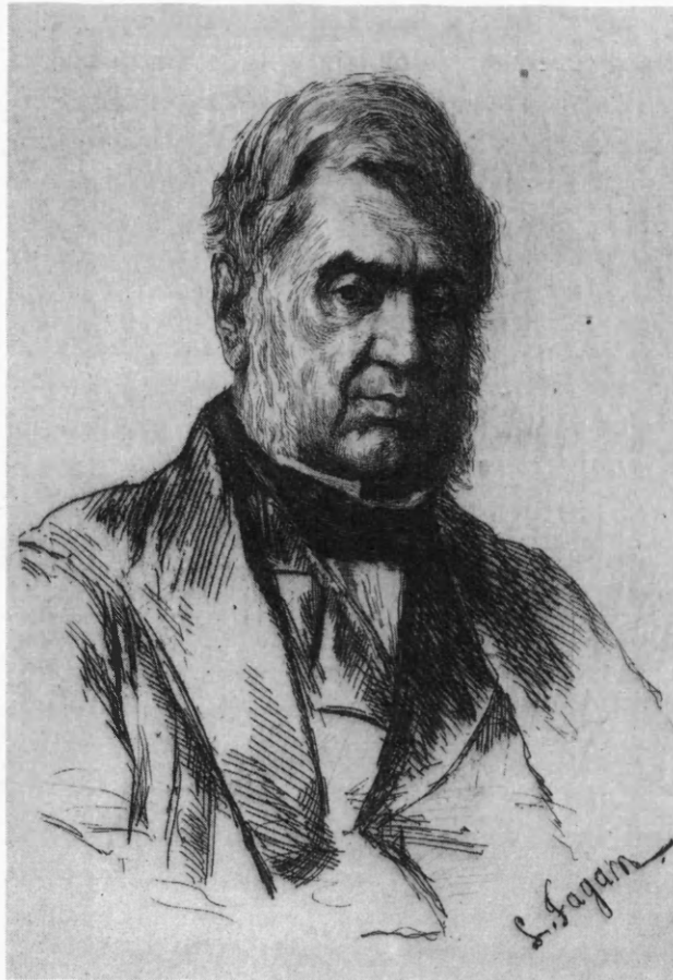
Antonio Panizzi, 69 år gammel. Tegning af Louis Fagan 1866. Fra Fagan: The Life of Sir Anthony Panizzi . London 1880.

foregående år måttet optræde som vidne 18 gange for den kongelige kommission om British Museum! Forhandlingerne i kommissionen kom i stor udstrækning til at dreje sig om museumsbibliotekets kataloger, og kommissionsbetænkningen er en mageløs kilde for den, der interesserer sig for katalogiseringens væsen og katalogisatorers psykologi. 40 Men som Panizzis første biograf anfører, blev den kongelige kommission det forum, hvor Panizzi konfronteredes med det ideal om et nationalbibliotek, han selv havde formuleret. 41