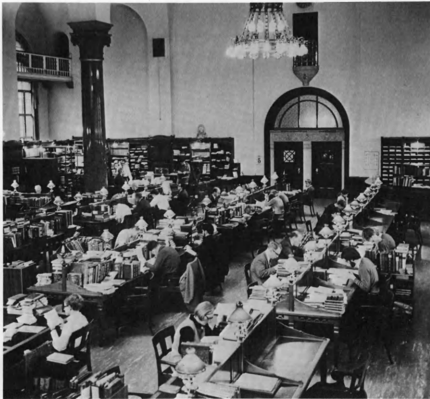
Læsesalen i Det kgl. Bibliotek, siden 1927 Københavns Universitets hovedbibliotek for teologi, humaniora og samfundsvidenskab.

rådighed for de lærere og studerende, som underviste og studerede i de pågældende institutter. Den samme bogs ene eksemplar havde således ét formål i et institutbibliotek, det andet eksemplar et andet formål i universitetsbiblioteket.