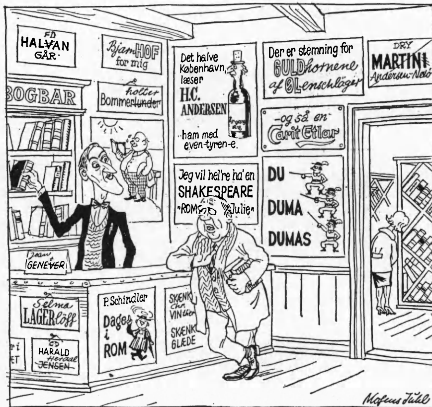
Den gamle restauration »Stationsgården« i Ballerup er blevet omdannet til kommunebibliotek - Tak, ingen H. C. Brannert i dag - jeg er i bil!