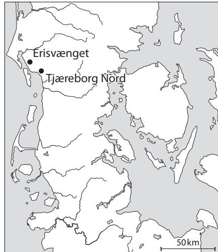
Fig. 1. Placering af de beskrevne pladser.

The production, distribution, and use of the swords will be discussed. Analyses of one of the swords, from Tjæreborg Nord, and the metal analysis hint at a possible local production of La Tène -swords, though using foreign resources. Further, the article discusses why La Tène -type swords spread to the Germanic area at the very end of the period when the La Tène -swords were used. It seems that the swords do not signify a certain social class, but rather a new military development which is incorporated into a social network of relationships between people.