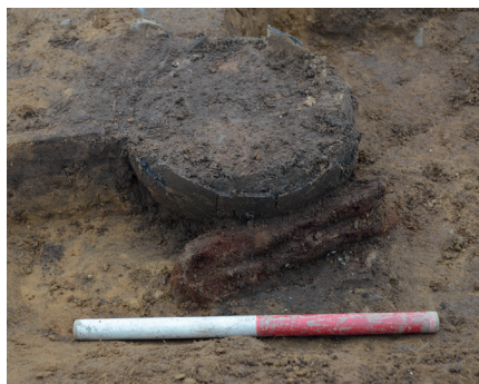
Fig. 7. Grav A1190 og sværdet under udgravning.

I det følgende vil de to sværdgrave blive gennemgået. Den ene grav, A1190, bestod af en urne, hvor overdelen var beskadiget, men hvor de brændte knogler og fundene ikke var berørt af pløjning (Fig. 7). Det kan derfor med sikkerhed siges, at de fundne genstande repræsenterer hele inventaret af gravgods. Til gengæld var urnen trykket af et nyere rør, og nedgravningen af røret har også delvist ødelagt spidsen og