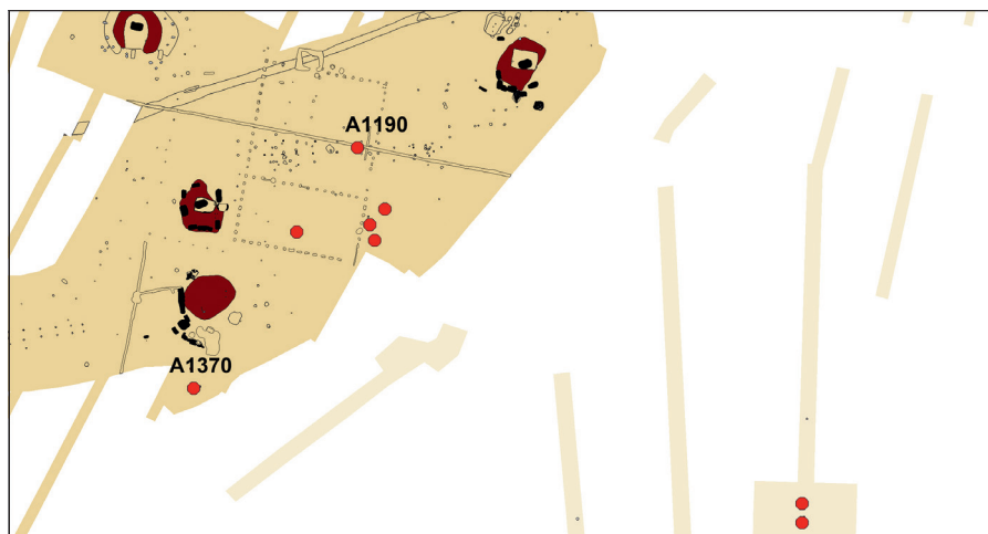
Fig. 6. Oversigt over Erisvænget II. Udgravede felter er markeret med gult. Med brunt er resterne af gravhøjene markeret. Sorte anlæg er grave. Brandpletter og urnegrave er markeret med røde pletter. De to grave med sværd er markeret.

Fig. 6. Plan of Erisvænget II. Excavated areas are marked yellow. Remains of mounds are brown. Graves are marked black. The red dots are firepit graves and urn graves. The two graves containing swords are indicated with their numbers (graphics: T. Torfing).