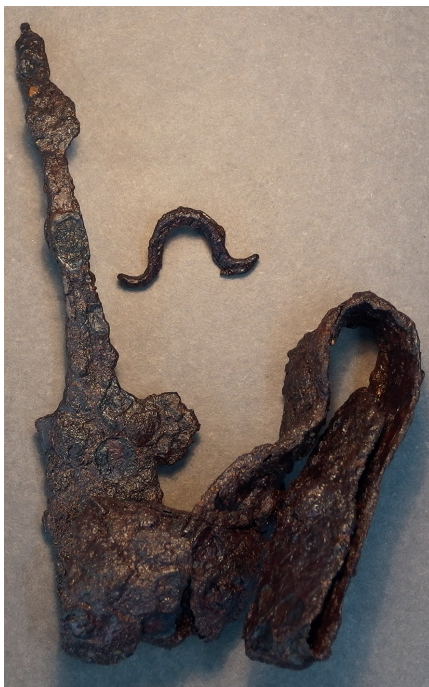
Fig. 4. Sværdet fra A0006. Fig. 4. The sword from A0006.