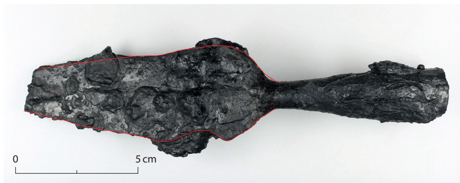
Fig. 9. Lansen fra A1370 med den oprindelige æg optegnet med rød.

Fig. 8. The sword from grave A1190.