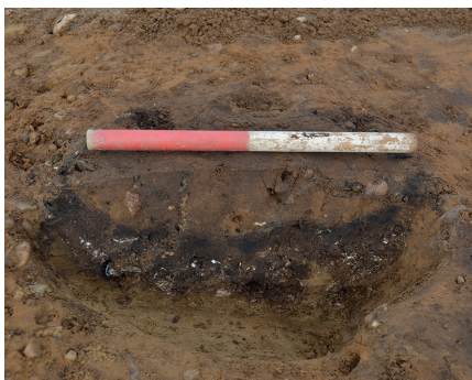
Fig. 3. Brandpletgrav A0006. Fig. 3. Firepit grave A0006.

Gravudstyret i disse består af synåle, mindre svajede knive, enkelte dragtnåle, samt enkelte fibler (sene K-fibler). Gravudstyret peger, sammen med urnernes form, facetterede rande og x-formede hanke, på en datering til Jensens periode II.2. Enkelte kan dog være fra periode II.1. (JENSEN 2005). Enkelte grave kan muligvis være fra overgangen til ældre romertid, herunder de to jordfæstegrave. Den ene jordfæstegrav