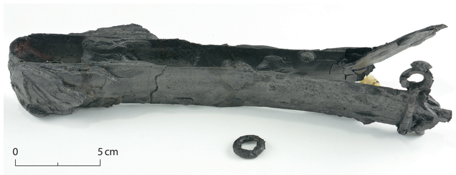
Fig. 8. Sværdet fra A1190.

Fig. 8. The sword from grave A1190.