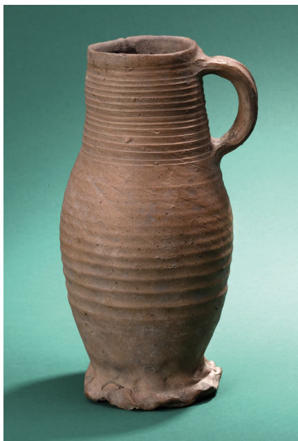
Fig. 1. Kande af rhinsk stentøj. Fundet nedgravet tæt ved soklen til et hus i Korsbrødregade i Ribe. ASR M7420, 7420. Datering: 1300-tallet.

Fig. 1. Stoneware jug from the Rhineland deposited close to the plinth of a house in Korsbrødregade in Ribe. ASR M7420, 7420. Date: 14 th century.