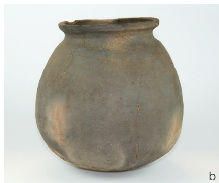
Fig. 7. a Den snittede grube med kuglepotten med bunden i vejret. b Kuglepotten som den fremstår i dag. ASR 1925x50. Datering: 1100–1200-tallet.

Fig. 7. a The pit with the globular bowl placed upside down; photo taken during the excavation. b The globular bowl as it looks today. ASR 1925x50. Date: 12 th –13 th centuries.