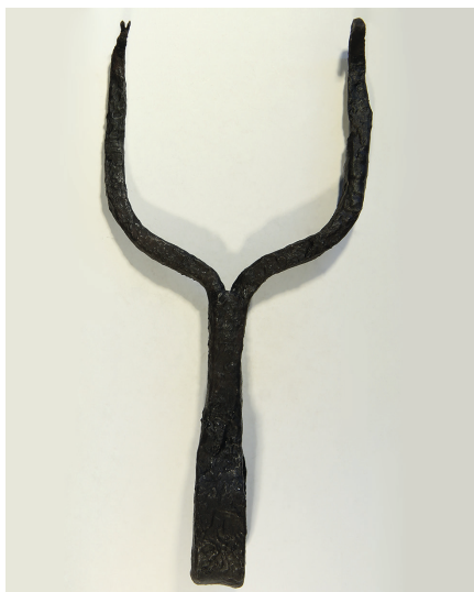
Fig. 8. Fragment af kødgaffel af jern. Længde: 16,5 cm. Tidlig middelalder. SJM 424x18.

Fig. 7. a The pit with the globular bowl placed upside down; photo taken during the excavation. b The globular bowl as it looks today. ASR 1925x50. Date: 12 th –13 th centuries.