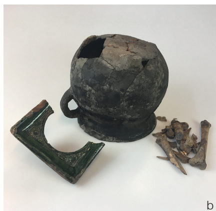
Fig. 4. a Tegning in situ af en anden af jydepotterne, stående med bunden i vejret. b Foto af potten og dens indhold af dyreknogeter samt en stump af en grønglaseret ovnkakkel, der stod lænet op ad potten i fundsituationen. ASR 11 x364, x366. Foto og tegning: SJM.