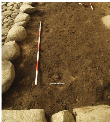
Fig. 5. Billede af stjertpotten i Vaskilde 3 in situ.