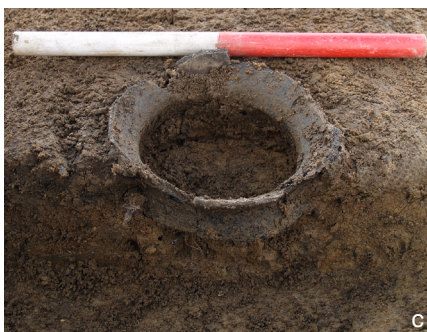
Fig. 6. Billede af de første tre eksempler: a Petersborg, b De to fra Bramdrup, c Ravnsbjerggård, Foto: Museum Sønderjylland.