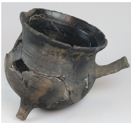
Fig. 3. To af de jydepotter, som fandtes nedgravede uden for et renæssancehus i Nygade, Ribe.