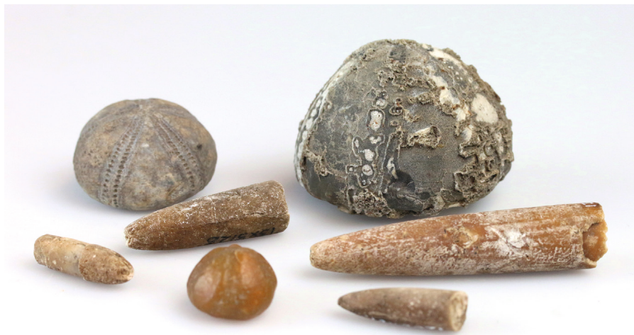
Fig. 9. Tordensten og vættelys fundet i middelalderlige kulturlag i Ribe. ASR 11 og ASR 13.