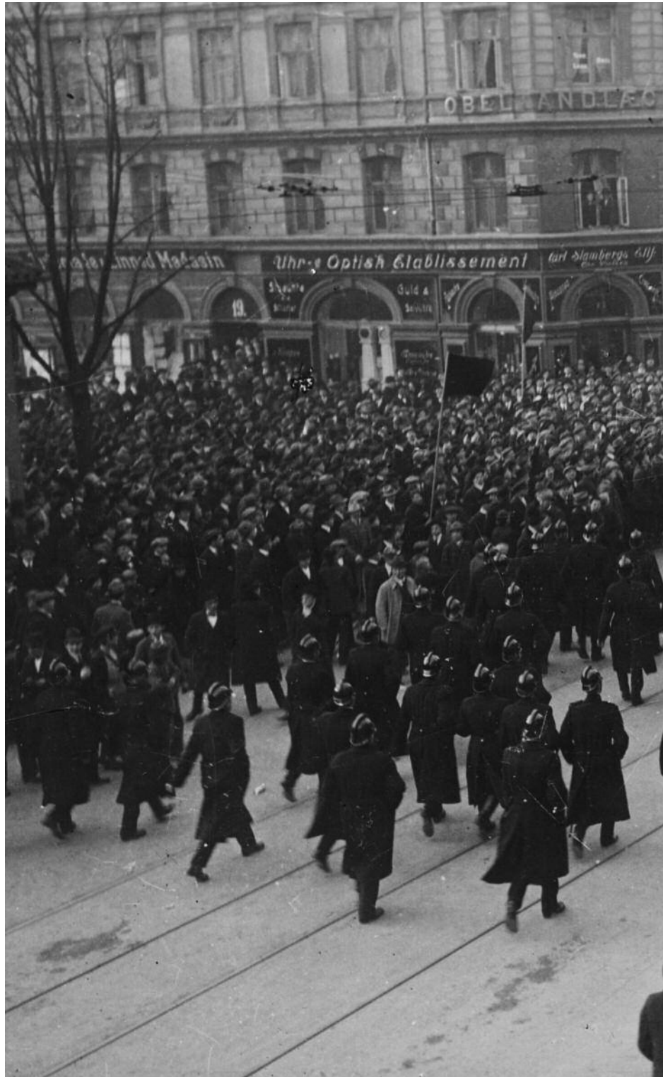
Socialisten Johannes Sperling taler til folkemængden på Grønttorvet fra toppen af en linje 15 sporvogn den 13. november 1918.