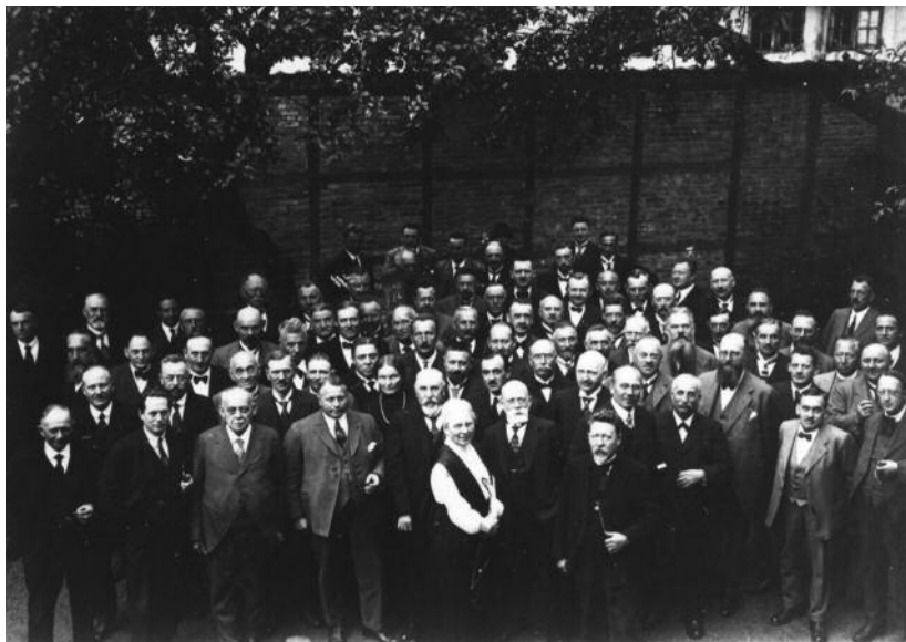
Fra Socialdemokratiets kongres i Odense i 1923.

lå i opbygningen af parlamentet. Såvel Thorvald Stauning som en række yngre konservative mente i starten af 1930'erne, at Rigsdagens tokammerssystem – hvor Folketing hhv. Landsting havde forskellig politisk dominans og kunne nedlægge veto over for lovforslag fra det andet – gjorde det politiske system uoverskueligt og ineffektivt. Antidemokrater havde en reel angrebsflanke, så Landstinget måtte væk. 28