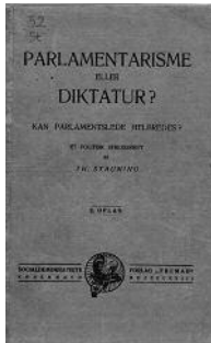
Staunings stridskrift fra 1923.