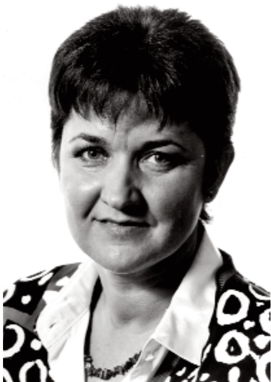
Jytte Andersen, født 1942, medlem af Folketinget for Socialdemokratiet i 1979, bl. a. arbejdsminister 1993-98. Formand for Socialdemokratiets indvandrerudvalg 1980-84.

er omfattende, og har en sammensat karakter, og især udvalgs materialet indeholder lange og fyldige mødereferater, mens referater fra hovedbestyrelsesmøder og forretningsudvalgsmøder overvejende er i stikordsform. 16 Samtidig kompliceres det hele af, at emnet fortsat er følsomt for de implicerede parter. 17