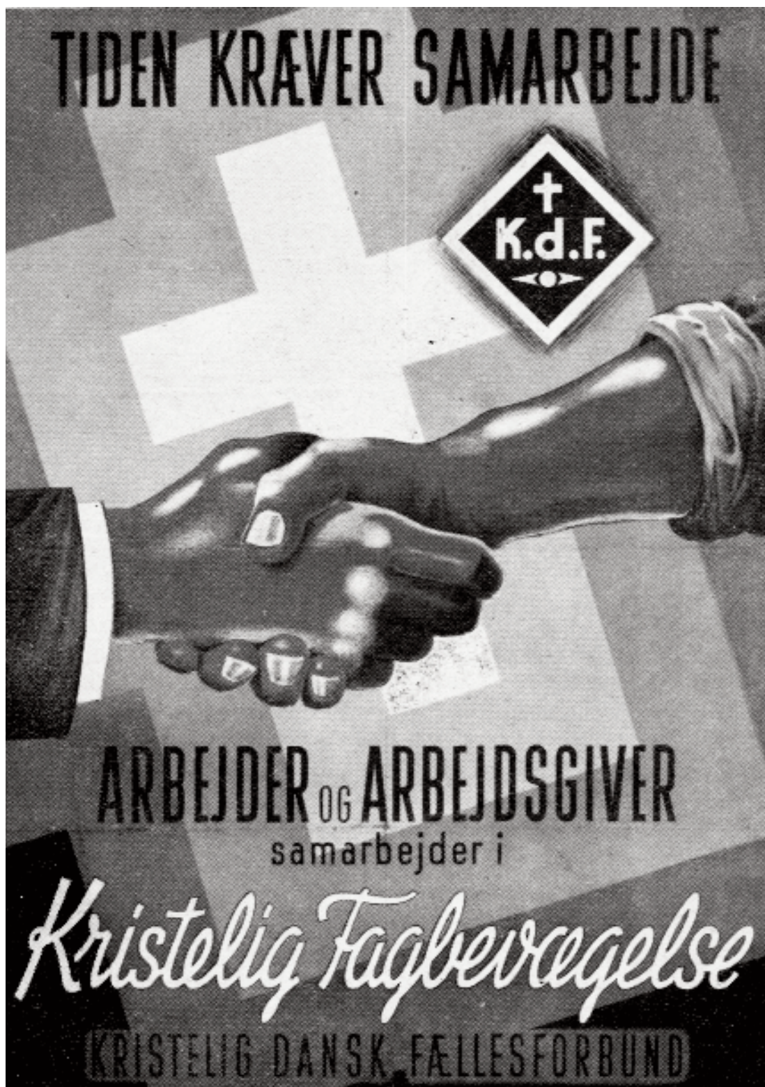
Plakat fra Kristelig dansk Fællesforbund. Forbundet blev stiftet i 1899 og organiserer både arbejdsgivere og lønmodtagere.