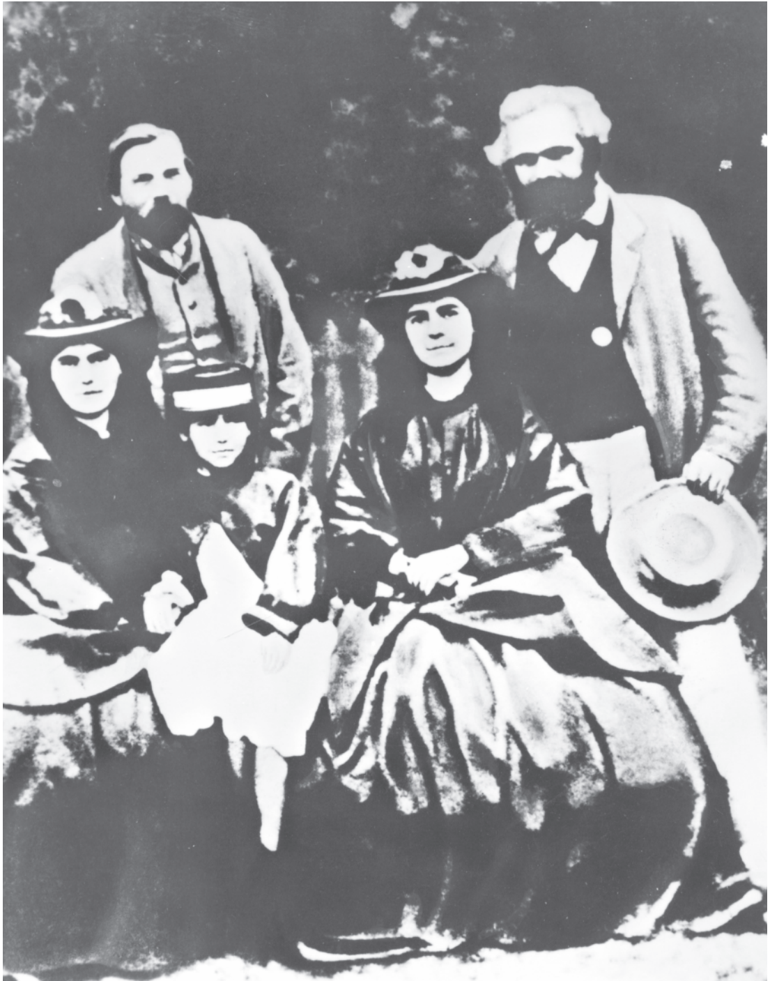
Karl Marx og Friedrich Engels sammen med Marx' tre døtre: Jenny, Laura og og Eleanor i 1864 i London.