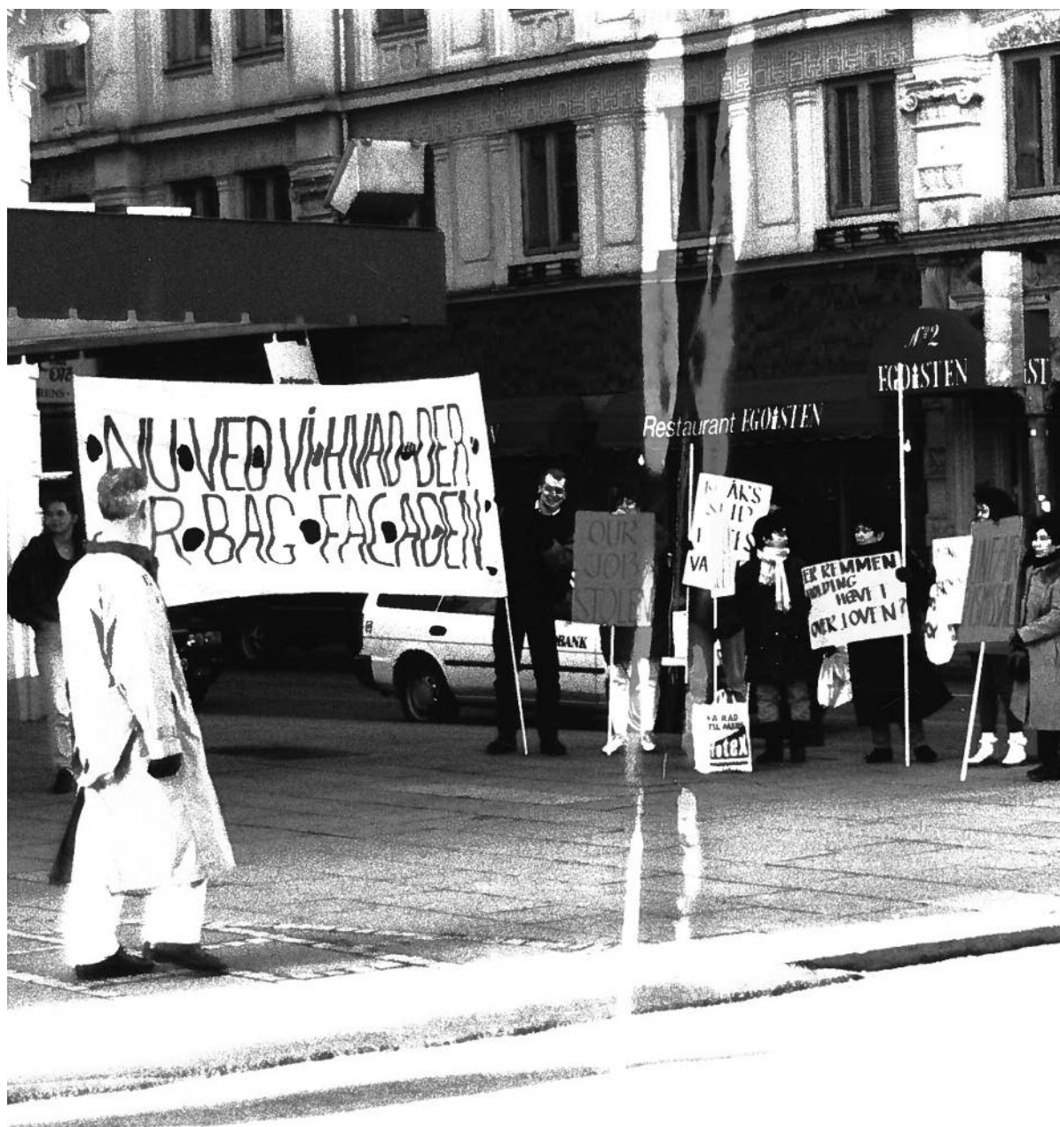
Bag facaden: I løbet 1990'erne var der adskillige faglige konflikter på de københavnske hoteller, heriblandt på Hotel d'Angleterre, hvor dette foto er fra, og de filippinske stuepiger var i disse år ofte i front i de faglige kampe. De to paroler på fotoet – "Er Remmen [Hotel d'Angleterres ejer, red] hævet over loven" og "Nu ved vi, hvad der er bag facaden" henviser bl.a. til hotellets brug af såkaldt piratringering.