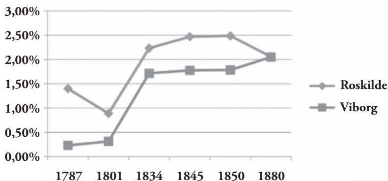
Figur 1. Plejebørns andel af befolkningen i Roskilde og Viborg amter 1787-1880.

Kilde: De indtastede folketællinger i Dansk Demografisk Database. I forsøget på at få flest mulig af plejebørnene med er søgt på "ple_eb*" (plejebarn i forskellige staveformer), "anta*" (et plejebarn kunne også være et "antagen barn" f.eks.), opfost* (opfostringsbarn, navnlig fra opfostringshuset, tilknyttet Pleje- og fødselsstiftelsen) "moderløs" etc. 23