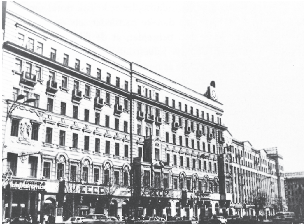
Hotel Lux – “verdensrevolutionens standkvarter”, som det undertiden blev kaldt. På dette hotel, der lå på Moskvas hovedgade ikke langt fra Komintern-bygningen, boede mange af de udenlandske kommunister, der for kortere eller længere tid opholdt sig i den sovjetiske hovedstad, f.eks. Aksel Larsen og Arne Munch-Petersen.

liv uden for arbejdspladsen. Og mange af disse mennesker slapper af, spiser, sover, ja, tilbringer i det hele taget næsten al deres sparsomme fritid på Lux. 3