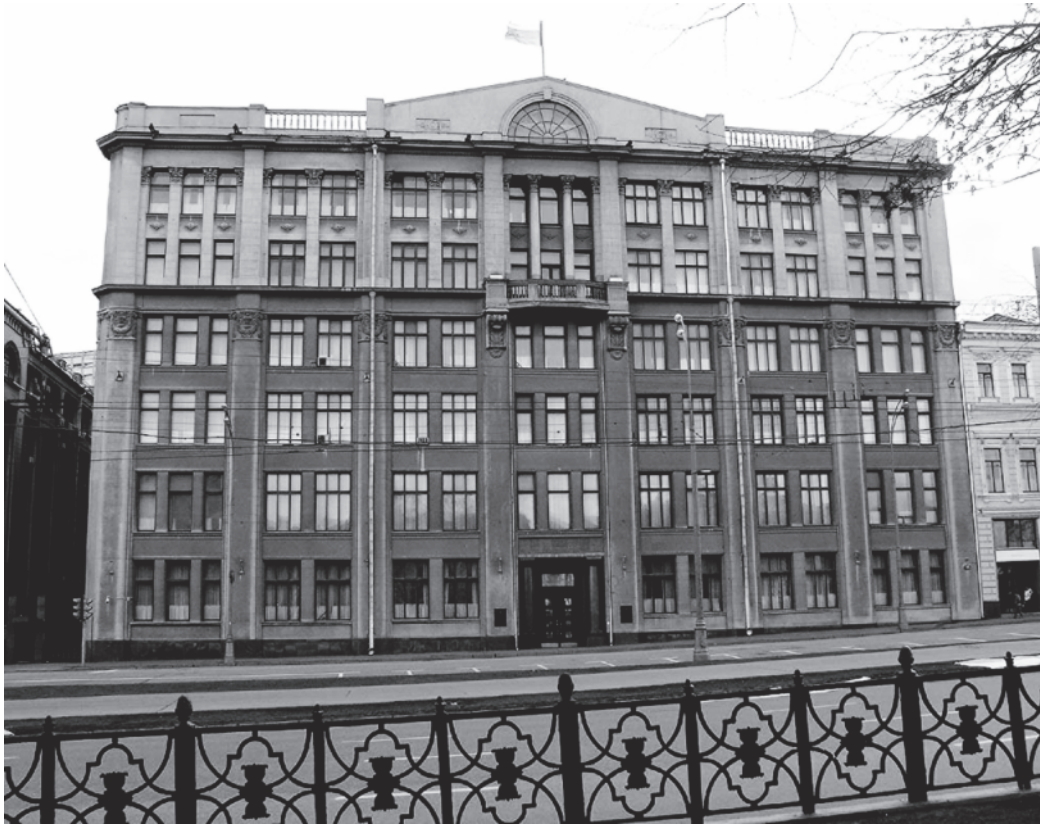
Gammel Torv – det sovjetiske kommunistpartis hovedkvarter i Moskva. Gennem en årrække eksisterede der her et tophemmeligt “informationsbureau”, der tog sig af Komintern-anliggender og andre internationale spørgsmål og først og fremmest servicede partiets generalsekretær Josef Stalin.

ville blive udsat for voldsomme prøvelser. Ud fra den synsvinkel gjaldt det om at kunne stå distancen for næsten enhver tænkelig pris. Dermed blev der konstant givet næring til en udpræget hensigten helliger midlet-filosofi.