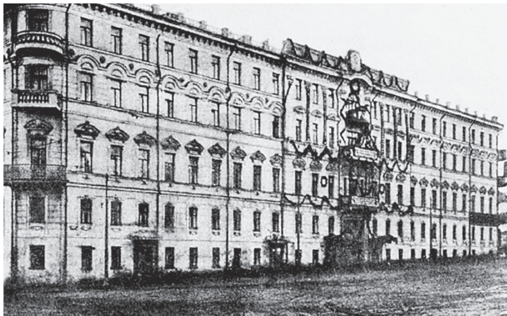
Manegepladsen – hjemstedet for Kominterns centrale stab i det meste af Mellemlkrigstiden. Øverst i bygningen, der lå klos op ad Kreml, befandt sig den velcamouflerede og omhyggeligt afskærmede “Afdeling for Internationale Forbindelser”, OMS, som styrede et gigantisk netværk af hemmelige “forbindelsespunkter” i diverse storbyer rundt om i verden, herunder København.

Moskvas udkant. Her bliver en god del af det mere tekniske OMS-arbejde udført. Det gælder f.eks. selve fremstillingen af de falske pas. Eller opbygningen af de nye superkraftige radiosendere, der er nødvendige for at få det samlede kommunikationssystem til at fungere. Eller oplæringen af nye talenter i radiotelegrafi, “konspirativ teknik” og brugen af våben og sprængstoffer. Også disse aktiviteter foregår naturligvis i det skjulte. Dele af arbejdet er eksempelvis camoufleret som “Den 8. base for international sport”. Kun de særligt indviede ved, at der ikke er mange chancer for at se toptrænede atleter folde sig ud her.