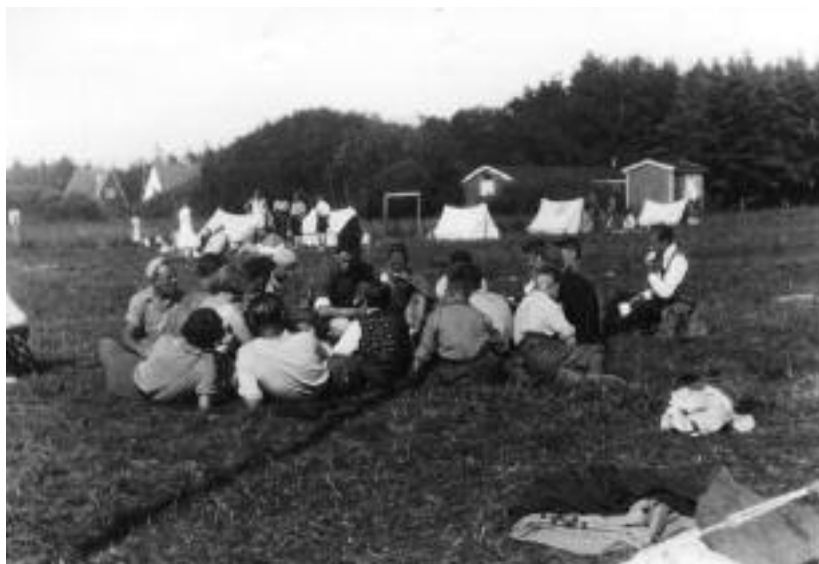
DSU Vesterbro på lejr tur ved Solrød Strand i 1933. (ABA)