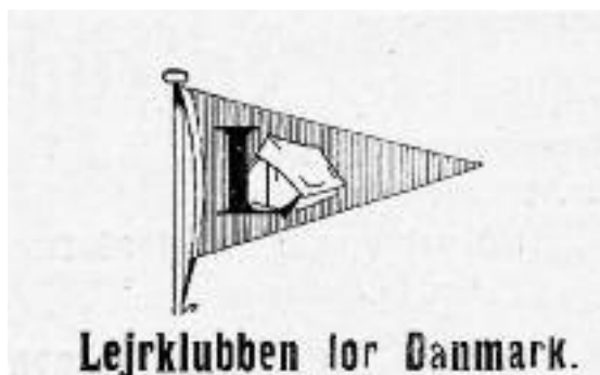
LD's bomærke og standerflag. (Lejrspport, 1935)

en lokal bonde om benyttelse af en strandgrund ved Hundige Strand. Efter en periode under primitive lejrforhold udvidedes Hundige Lejrens faciliteter i starten af 1930'erne så meget, at lejrbrugere i stadig højere grad kom til at omfatte børnefamilier, der boede i lejren gennem hele sommerperioden, hvorfra manden cyklede eller senere tog DSB-rutebilen til fabrik eller kontor i hovedstaden.