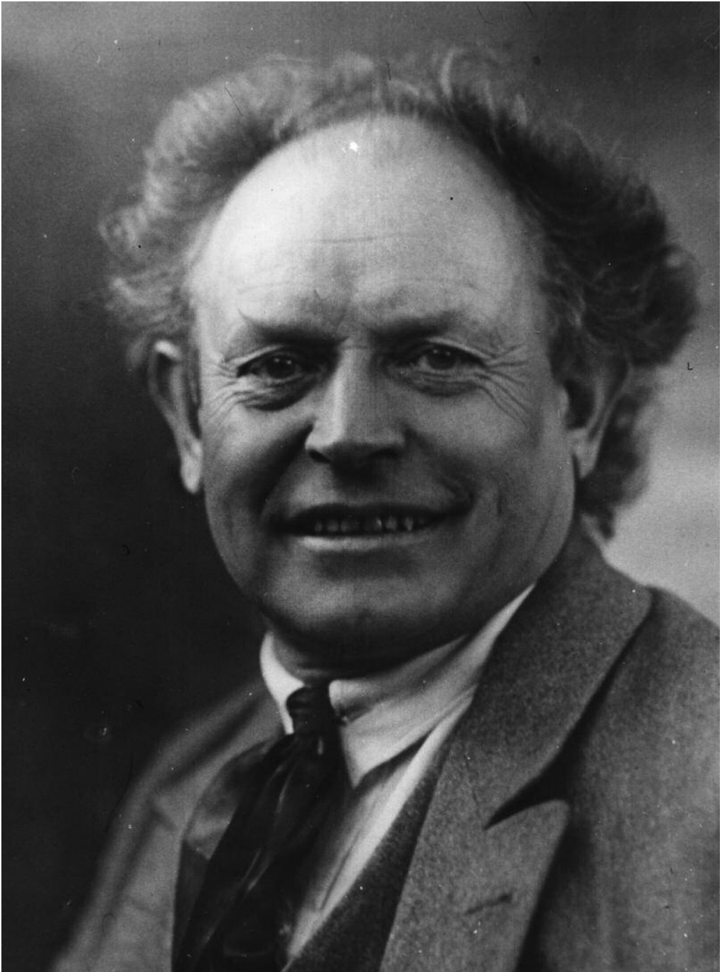
Portræt af Martin Andersen Nexø fra 1922. I dette år foretog Andersen Nexø en længere rejse til Sovjetunionen. Først til Sovjetkarelen og sender som officiel gæst ved Kominterns 4. kongres. Han besøgte også et børnehjem i Samara, der var blevet opkaldt efter ham.