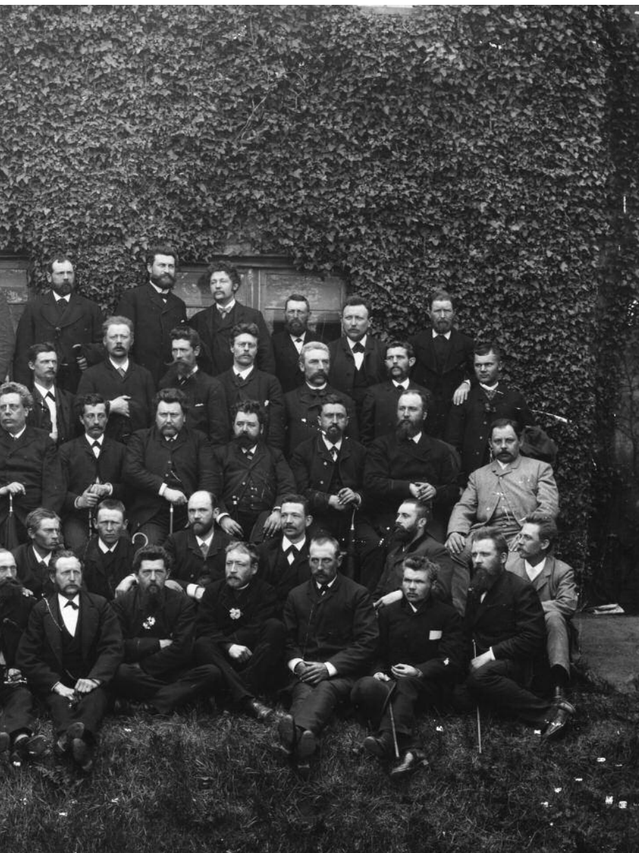
Deltagerne i Socialdemokratiets kongres, der fandt sted 19.-22. juni 1890 i forsam- lingsbygningen i Romersgade.

tolv år gamle program. I 1882 havde der været nogle mindre ændringer, der dog ikke havde været af teoretisk karakter. 1888-programmet adskilte sig fra Gimle-programmet ved, at bevæge sig i en mere marxistisk retning. Især programmets andet afsnit, hvor Socialdemokratiets hovedmål fastslås, havde undergået en forandring. Mens Gimle-programmet, der som løsning på de sociale spørgsmål havde fremsat den lassalleanske teori om produktionsfor-