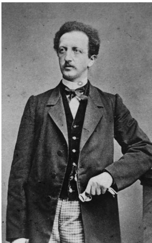
Ferdinand Lassalle, en af grundlæggerne af det tyske socialdemokrati

hvad der siden udkrystalliseres som en selvstændig socialdemokratisk ideologi. Det vil jeg i denne artikel forsøge på, på marxismens vegne, i perioden fra den socialdemokratiske ideologis start og frem til tiden omkring første verdenskrig. Med andre ord skal det undersøges hvilke ideer fra marxismen der blev videreført i den danske arbejderbevægelse og hvilke der blev forkastet. Hvorfra der åbnes op for en undersøgelse af hvorfor disse ideer fandt genklang hos datidens socialdemokrater.