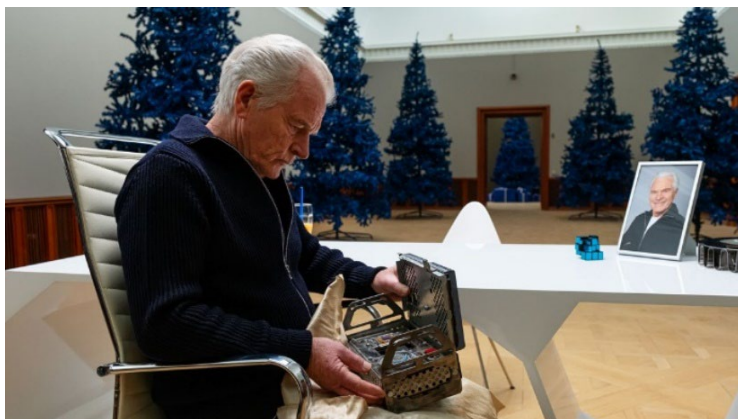
Figur 7. Karakteren Viggo (Kurt Ravn) på sit kontor.

plottet udvikler sig, hjælper karaktererne hinanden, først med at få Mie og Johannes hjem og efterfølgende med at bekæmpe Viggo.