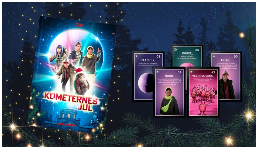
Figur 2. Samlekort og samlealbum. Foto: TV 2 (Larsen, 2021)

Brugen af tværmedielle strategier i danske julekalendere har således eksisteret i mange år, men har ændret sig med teknologiens udvikling, hvilket kan være endnu en forklaring på julekalenderens overlevelse i en streamingkultur. I forlængelse heraf vil jeg undersøge, om også brugen af storyworlds, der etablerer en reference til den faktiske verden, kan bidrage til at gøre julekalender-subgenren relevant for seerne, og i så fald hvordan.