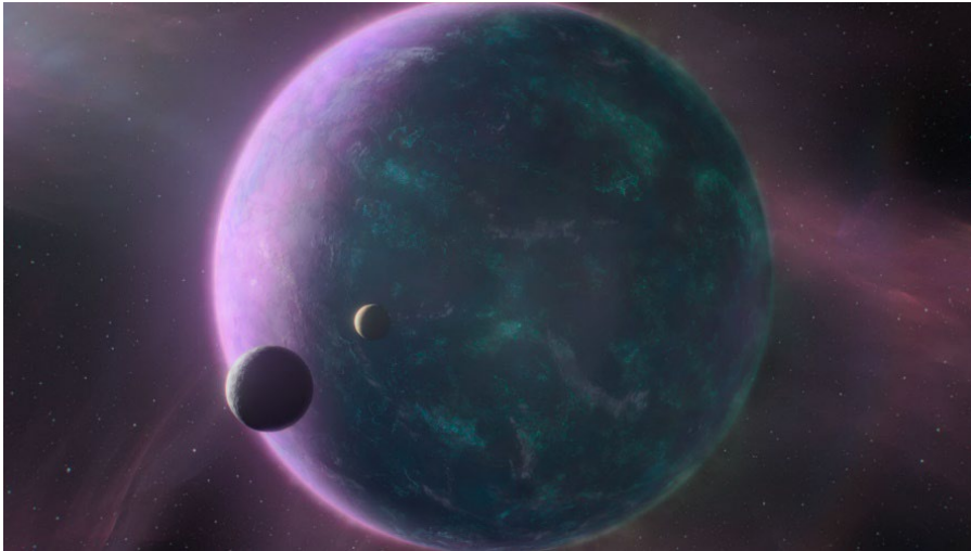
Figur 8. Planet 9 fra Kometernes Jul.

Planet 9 iscenesættes med lyserøde og blå farver. Ofte anvendes mørk lyssætning i fremstillingen af planeten, hvilket kan mystificere planeten og understøtte den som en fjern planet, der ikke vides meget om i TAW. Planet 9 mystificeres også, da den indledningsvis iscenesættes med ontologiske huller, eksempelvis magiliummets funktion, som seerne kan udfylde i takt med, at karaktererne lærer planeten at kende. Seerne kan dog kun opdage dele af planeten, som subjettet fremviser.