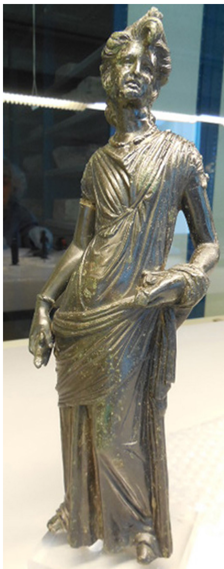
Fig. 3 – Bronzefigur af stående kvinde. Leiden Rijksmuseum inv. CO 30.