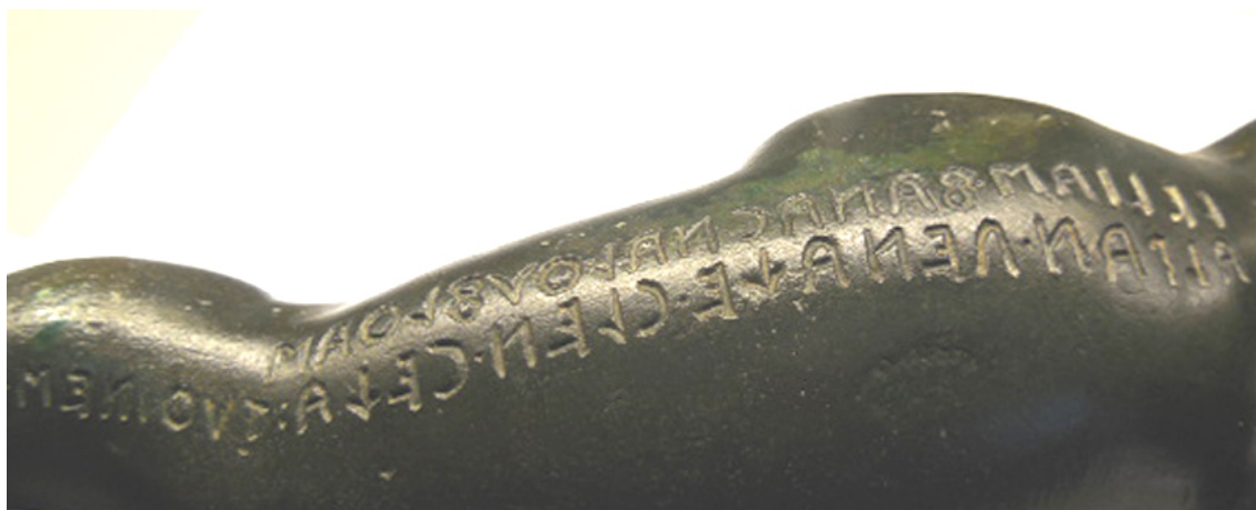
Fig. 2 – Detalje af indskrift på fig. 1.

genstanden gives. Der er en del eksempler herpå i etruskiske dedikationsindskrifter. 6