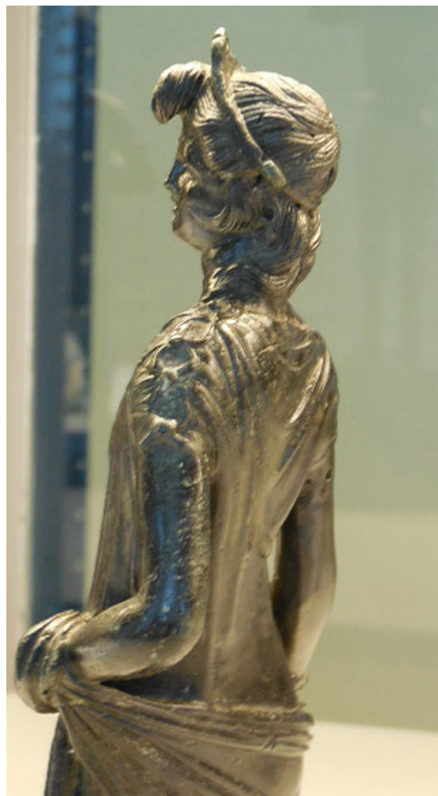
Fig. 4 – Detalje af venstre side af fig. 3.

En lignende, men noget mindre kvindefigur, har også en indskrift på bagsiden af kappen: