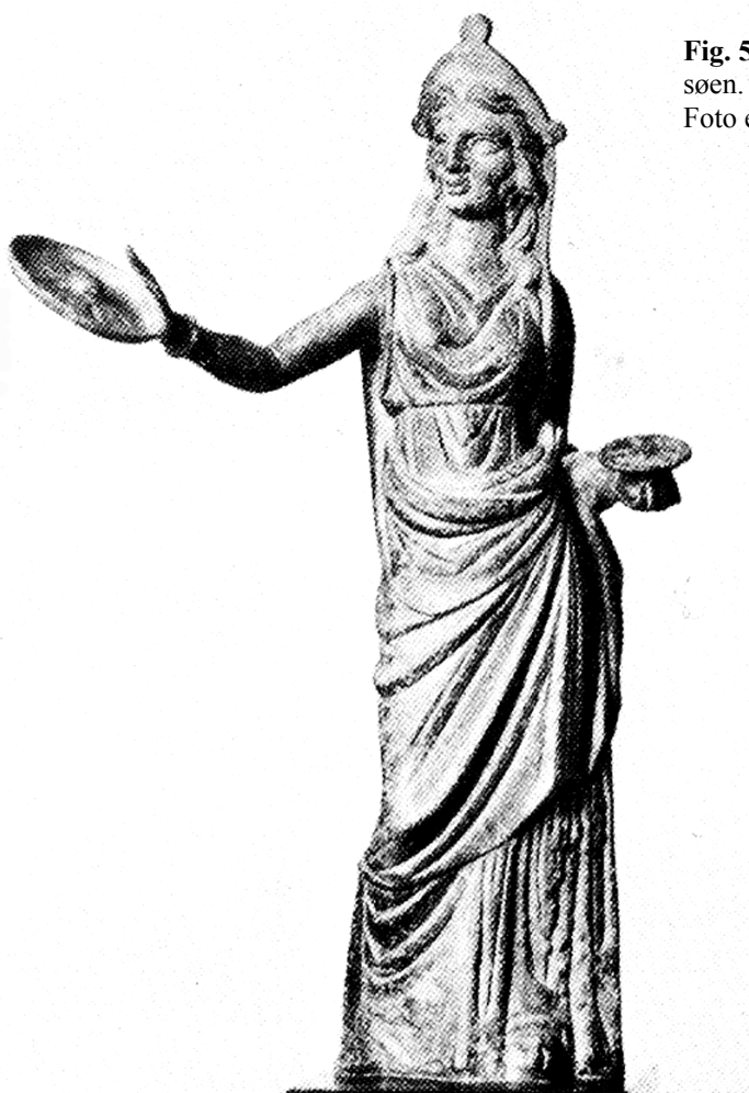
Fig. 5 – Bronzefigur af kvinde fundet ved Nemi-søen. British Museum 1913,5-29.1.

En parallel til Montecchio kvindefiguren i større format er en statuette i British Museum på 26,2 cm. 16 Den indgik angiveligt i en gruppe bronzefigurer, der blev fundet ved Nemi-søens bred. De dateres af Haynes til det 2. årh. f.Kr. på grundlag af stilen. (Fig. 5). De fyldige læber med nedadtrukne mundvige såvel som håret, der falder i løse lokker over skuldrene, er kriterier, der forbinder de to statuetter, selvom kvalitetsfor-