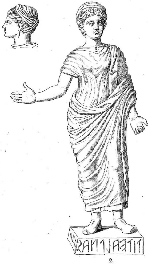
Fig. 6 – Bronzefigur i Museo Gregoriano Etrusco inv. 12025. Efter Annali dell' Istituto 1861.

ring er omdiskuteret. 26 Et andet forslag går ud på, at anledningen til dedikationen skulle være at giveren har haft en åbenbaring. 27