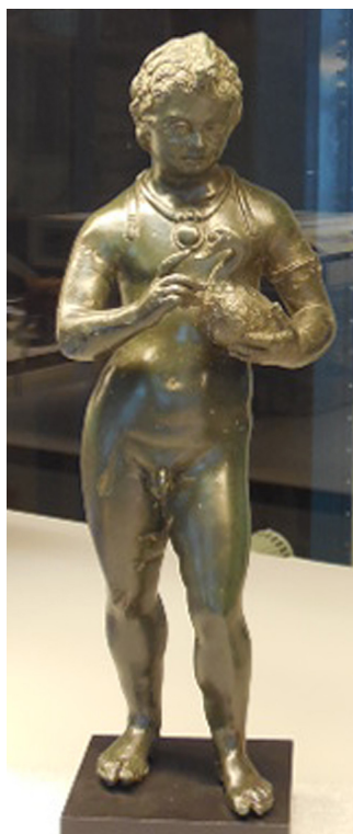
Fig. 1 – Bronzefigur af dreng med fugl. Leiden Rijksmuseum inv. CO 4.

Manglen på direkte paralleller har ført til usikkerhed om dateringen. Visse træk peger tilbage mod slutningen af det 4. årh. f.Kr. eller første halvdel af det 3. årh. f.Kr., men der er ingen vægtige grunde til at afvige fra den datering omkr. 150 f.Kr., som Bianchi Bandinelli nåede frem til i sin stilistiske analyse. Frisuren med fletningen, der ligger over issen og ender i en stor krølle over panden, går tilbage til Lysippos' bueskydende Eros fra omkr. 330 f.Kr. 4 , men især på børnefigurer forsætter den helt frem til romersk tid, f.eks. på en løbende eller svævende Eros i Madrid. 5