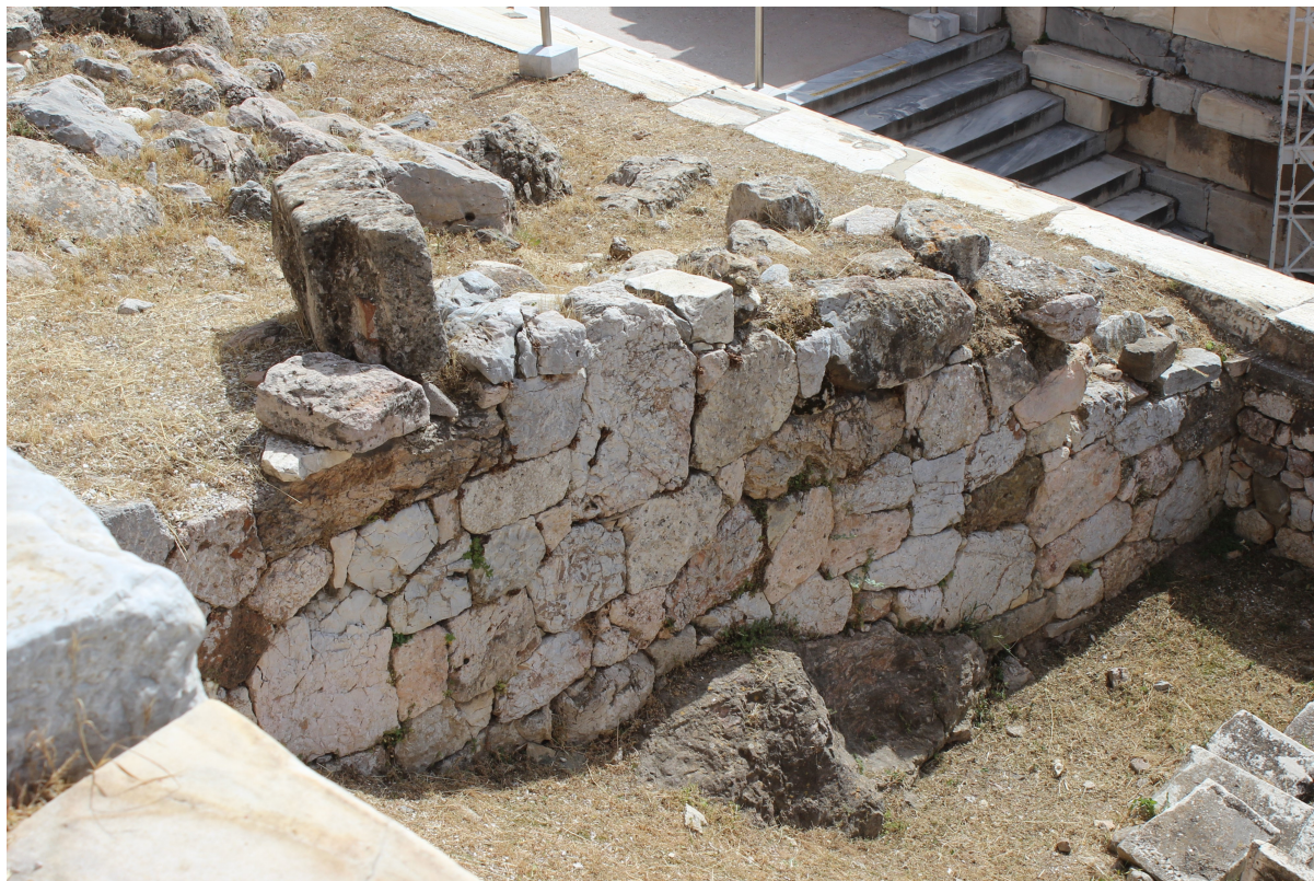
Fig. 2. Nordmuren i den arkaiske rampe, indgangen til Akropolis (foto KWJ).

farverige skulpturer af dyre- og monsterkampe, som man kan se udstillet på Akropolis Museet i Athen (fig. 1). På baggrund af stilen er templet dateret samtidig med reorganiseringen af de Panathenæiske Lege i 566/5. Templet dateres også samtidig med opførelsen af en ny indgang med en rampe, 23 som gjorde det muligt at transportere de monumentale stenblokke til det nye tempel op på højen (fig. 2). Rampen var også nyttig