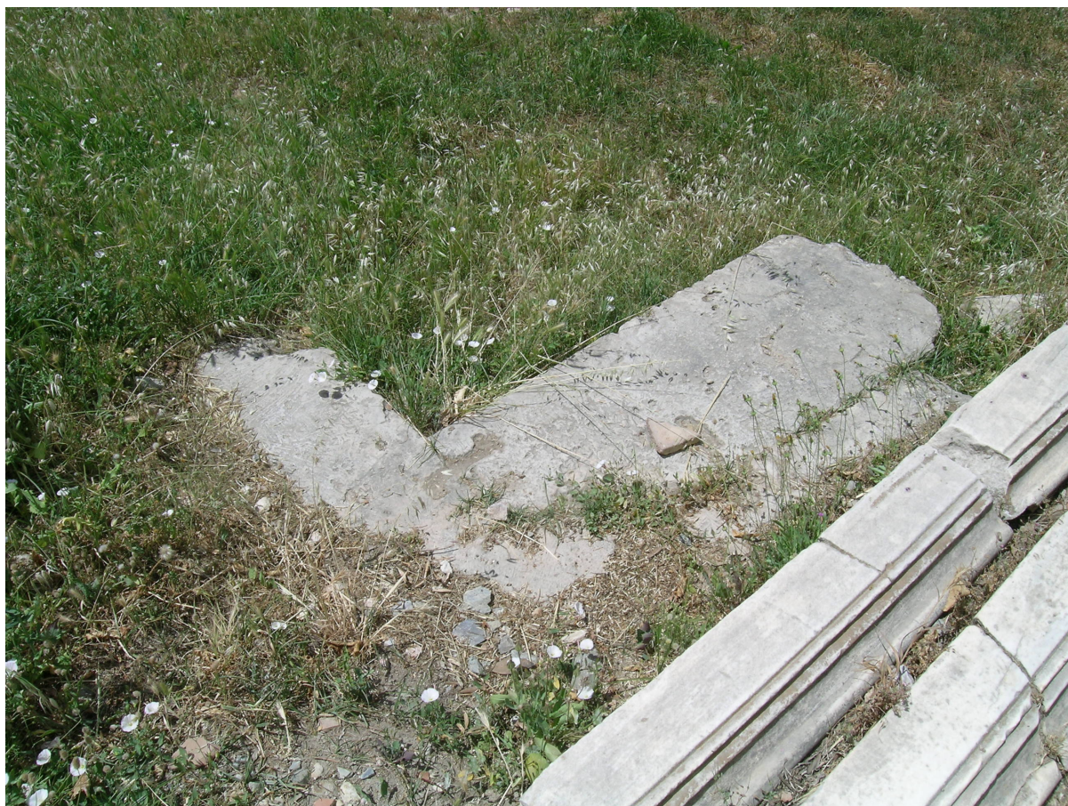
Fig. 6. Nordøst-hjørnet af Sydøst.brøndhuset med hullet til Z-klampen.

530 og kan dermed knyttes kronologisk til peisistratiderne. Brøndhus-scenerne viser kvinder med hydriaer, som henter vand i en bygning markeret med søjler, og vandet løber ud af løvehoveder i væggen. Fremstillingerne omtales typisk som genrescener, fordi de ikke viser specifikke begivenheder, men såkaldte dagligdags aktiviteter. Brøndhuse af den afbildede type er overleveret arkæologisk. I sydøsthjørnet af Agora, lige syd for den lille byzantinske kirke dedikeret til de hellige apostle, kan man se det undselige