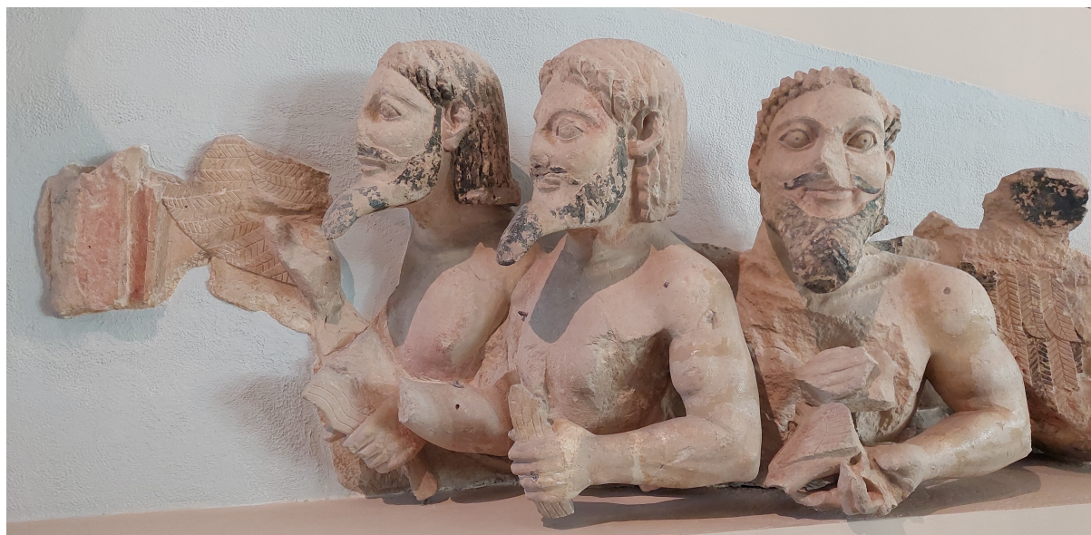
Fig. 1. Hekatompedon, vest-gavlen, Akropolis Museet.

Indførelsen af det demokratiske styre krævede etablering af nye institutioner, som understøttede de nye rettigheder, men de grundlæggende forudsætninger for forankringen var i høj grad etableringen af et særligt forhold mellem demos og guderne, og mellem by og land. Spørgsmålet er, om det er muligt at påvise en styrkelse af de samme forhold under tyrannerne? Akropolis var allerede under tyrannerne Athens vigtigste helligdom dedikeret til byens skytsgudinde. 20 Den arkæologiske rekonstruktion af det arkaiske Akropolis er foretaget på baggrund af ganske få fundamenter samt rester fundet uden for deres originale kontekst, enten genbrugt i befæstningsmuren og i fundamenterne til de klassiske bygninger, eller i opfyldningslagene bag befæstningsmuren. 21 Opførelsen af det ældste kendte monumentale tempel på Akropolis, det såkaldte Hekatompedon, dateres i anden fjerdedel af det 6. årh. 22 Det var et peripteralt dorisk tempel med 6x14 søjler opført i kalksten med gavle dekoreret med storslåede