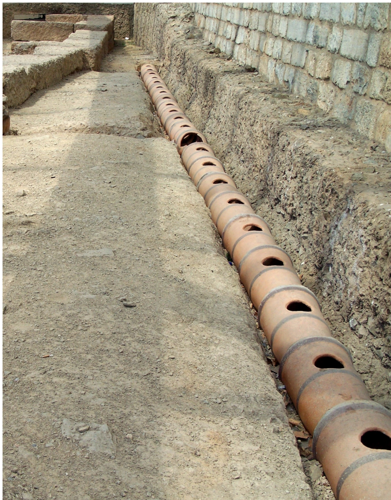
Fig. 7. Rekonstruktion af den peisistratidiske akvædukt på Syntagma-stationen.

Attika er et tørt landskab, og rent vand var værdifuldt. 58 Peisistratiderne forbindes arkæologisk med opførelsen af en underjordisk akvædukt fra Hymettos-bjerget tværs