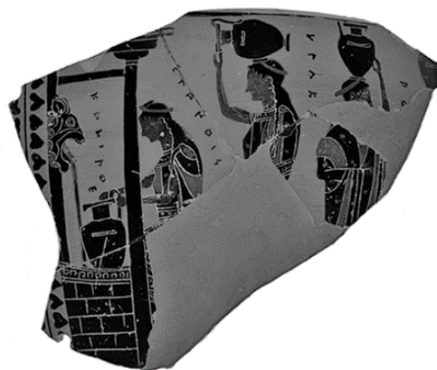
Fig. 5. Kvinderne ved Enneakrounos-Kallirhoe, Athen National Museum, Akr. 732 (foto tilpasset fra J. Neils & D. Rogers (red.), The Cambridge Companions to Ancient Athens , Cambridge 2021, 117, fig. 8,2).

Tyrannerne tilskrives i skriftlige kilder opførelsen af Enneakrounos, et stort brøndhus med ni brøndhoveder ved Kallirhoe-kildens udspring ved Ilissos-flodens bred. 50 Desværre er det endnu ikke lykkedes at identificere Enneakrounos i området syd for Zeus Olympaios-templet. Der findes til gengæld to afbildninger på sortfigurs-hydriaer, hvor kvinder henter vand i et brøndhus med påskriften "Kallirhoe", så det er altså specifikke afbildninger af Enneakrounos (fig 5.). 51 Attiske vaser dekoreret med såkaldte brøndhus-scener var særligt populære i senarkaisk tid, hvorfra der er overleveret 75. 52 De ældste dateres omkring