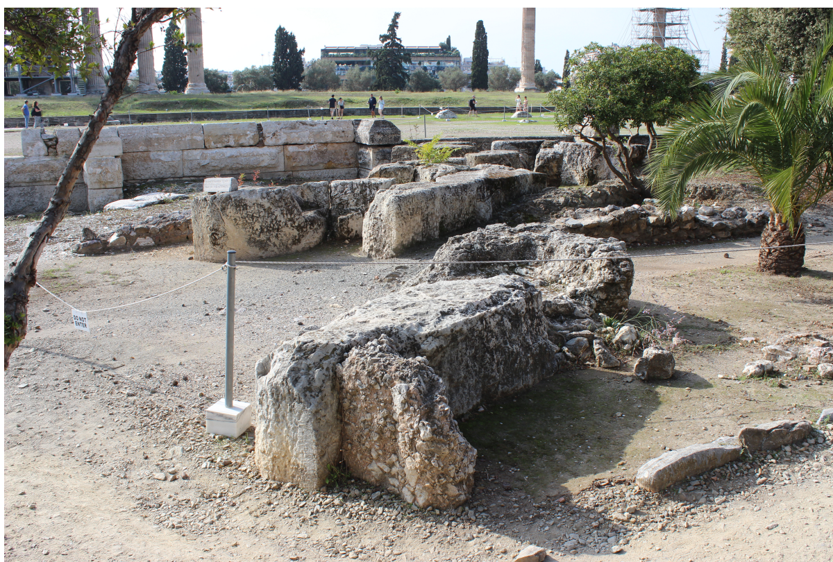
Fig. 3. Rester af den Themistokleiske befæstningsmur med genanvendte søjletromler fra det senarkaiske Zeus Olympiaion-tempel.

Sydøst for Akropolis i området ved Ilissos-floden, som forbindes med tyrannerne og den arkaiske by, ligger det kolossale Zeus Olympiaios-tempel som monument for tyrannernes fromhed. Ifølge en skriftlig kilde blev det påbegyndt af Peisistratos' sønner efter faderens død, og efter deres fordrivelse lå det ufærdigt hen. 42 Det var et dipteralt dorisk tempel omgivet af en dobbelt søjlerække med otte søjler i front, og med sine 41x108 m ville det have været det største tempel på det græske fastland, hvis det var blevet bygget færdigt. De eksisterende ruiner dateres i 2. årh. e.v.t., men på nordsiden ligger flere mere eller mindre ødelagte kalkstenssøjletromler, som stammer fra det oprindelige tempel påbegyndt i ca. 520 f.v.t. Søjletromlerne har været genanvendt i den