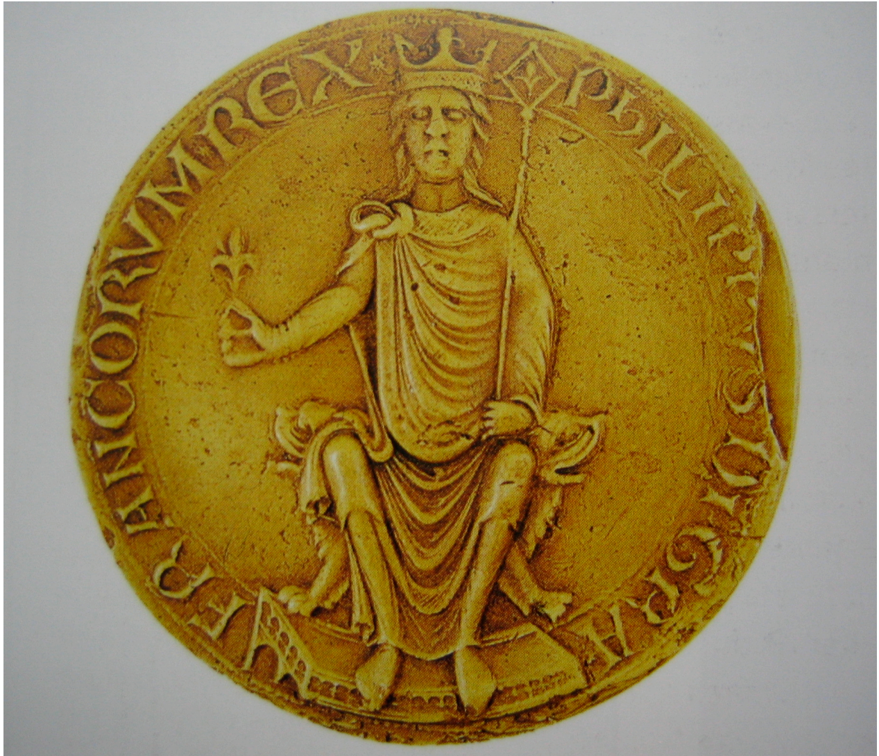
Fig. 6: Philip August' segl. Kongen (med krone) sidder på en sella udsmykket med løver og holder en lilje i højre hånd og et scepter med lilje i venstre. 1209. Indskrift: Francorum Rex Philippus Di Gra(tia) , diam.75 cm. Archives Nationales, Paris.

På Cité-øen begyndtes genopførelsen af bispens bolig og af Hôtel-Dieu, der var bestemt til fattige og syge pilgrimme. Det fortælles, at en rig engelsk pilgrim på sin vej hjem fra Jerusalem havde købt en hel sal i det gamle Hôtel-Dieu til atten fattige studenter