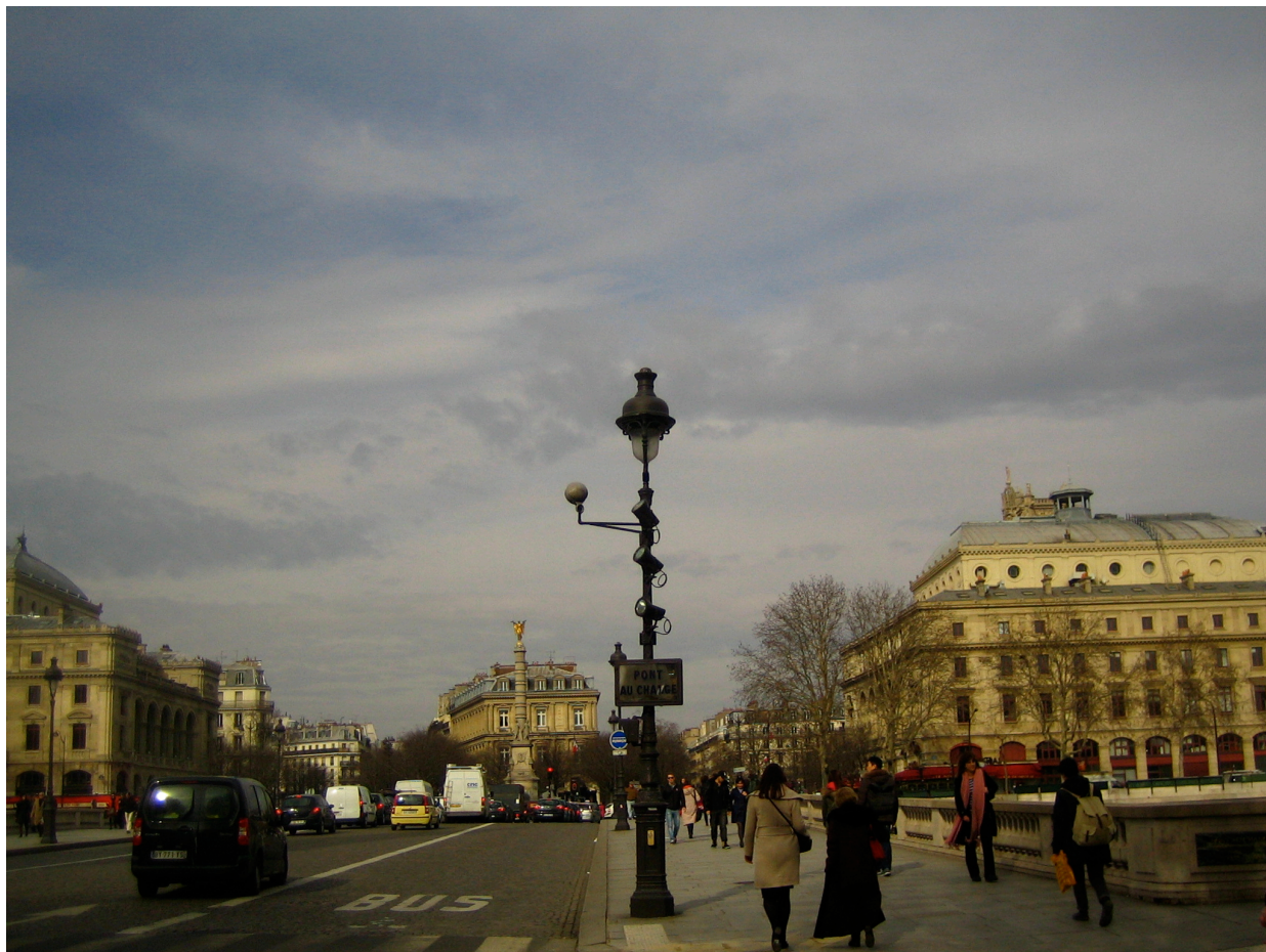
Fig. 2: Udsigt fra Citéøen mod højre Seinebred over Pons Magnus, senere kaldt Pont au Change, vekslerbroen, som fortsatte i Rue Saint-Denis (tv. for søjlen). Grand Châtelet lå over broen til venstre.

mænds boliger lå nær handelscentrene på højre Seinebred, hvor også kongens juridiske embedsmænd, les prévôts, holdt til i Grand Châtelet; venstre bred var mere tyndt befolket