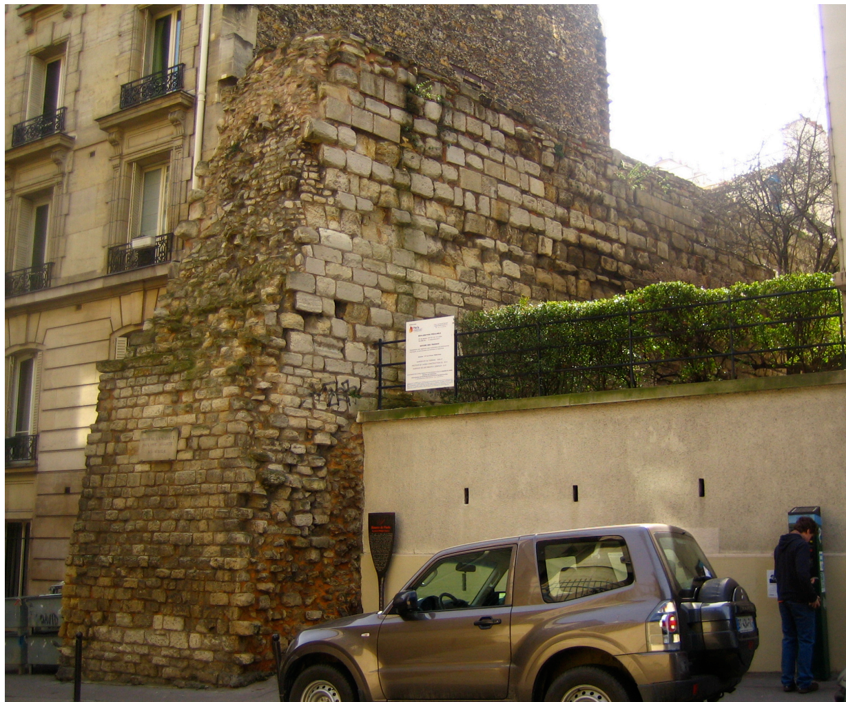
Fig. 5: Et stykke af Philip August' mur ved Rue Clovis, tæt ved det tidligere Sainte Geneviève-kloster.

på korstog til det hellige land sammen med den tyske kejser Frederik Barbarossa og Englands og Aqvitaniens Richard Løvehjerte. De tre mødtes i benediktinerklostret i Vezelay, hvis kirke ejede et relikvie der stammede fra den hellige Maria-Magdalena.