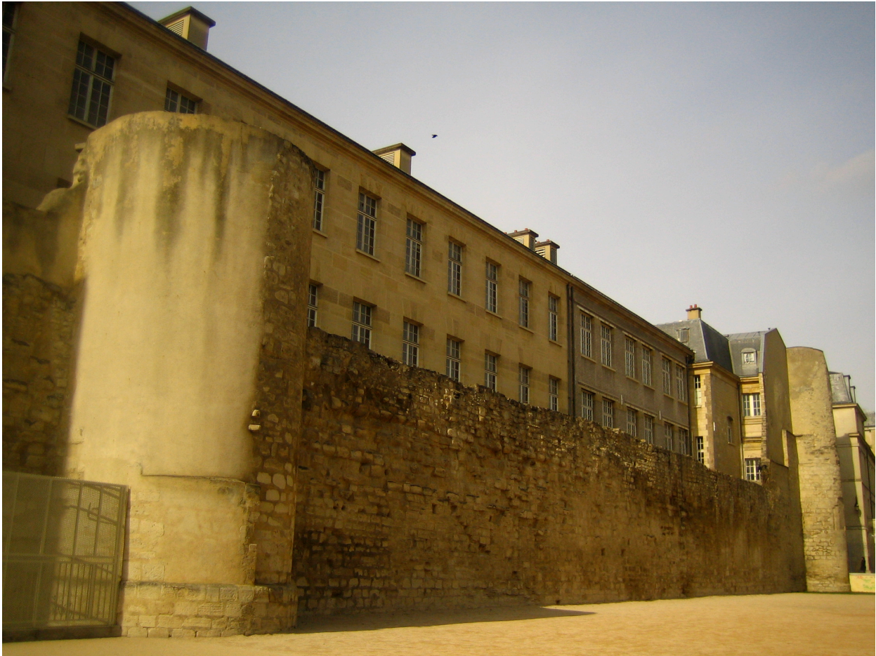
Fig. 4: Det længst bevarede stykke af Philip August' mur med to tårne ved rue Charlemagne og rue des Jardins-Saint-Paul. I dag afgrænser den en boldbane mod vest.

I Paris fortsatte Philip August sine byggerier, og mens byen mod øst og nord var omgivet af floderne Oise og Marne, der delvis gav beskyttelse, var det nødvendigt med større forholdsregler mod vest for at forhindre invasion af de engelske normannere; de skulle senere som et modtræk bygge borgen Château Gaillard (færdigbygget 1196) ikke længere end 100 km væk fra Paris. Kongen fik den ide at lade en massiv mur opføre rundt om hele Paris, men kort efter beslutningen om at befæste Paris måtte han imidlertid drage af sted