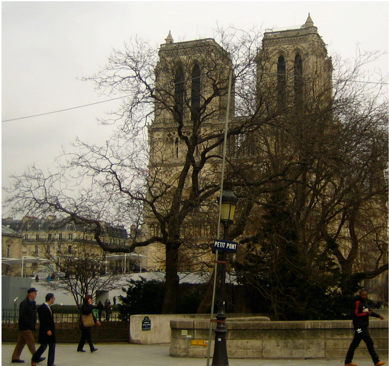
Fig. 1: Petit Pont som broen også hedder i dag. I baggrunden en del af Notre-Dame de Paris' facade mod vest. Tårnene stod først færdigbygget 1245.

var tæt. Spredt rundt om i Paris lå der kirker som Saint-Germain-l'Auxerrois og Saint-Merri på højre Seinebred, Saint-Julien-le-Pauvre på venstre og abbedier som Saint-Germain-des-Prés, Saint-Victor og Sainte-Geneviève på venstre. De velhavende køb-