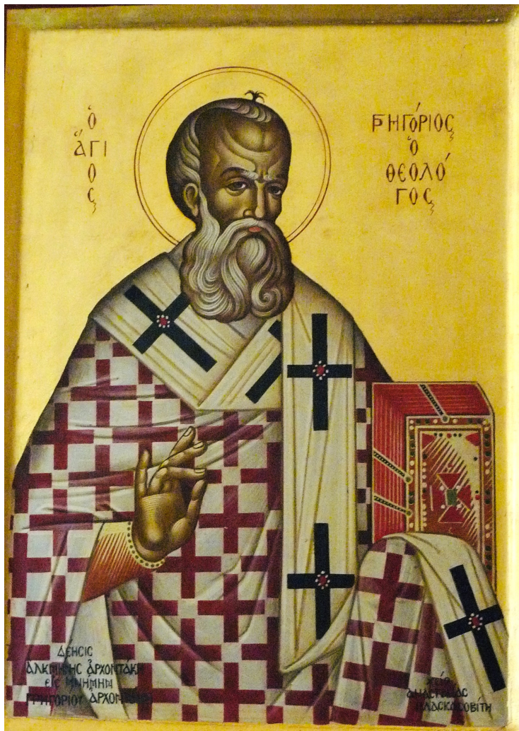
Bild 1. Ännu idag vördas 300-talets lärda kyrkofäder. Här Gregorios av Nazianzos Teologen (ὁ ἅγιος Γρηγόριος ὁ Θεολόγος) på en modern ikon från helgonen Georgios och Sabas kyrka i Mochos på Kreta.

frågan, behöver vi först en redogörelse för Gregorios och Basileios liv och speciellt deras relationer till Athen. 5