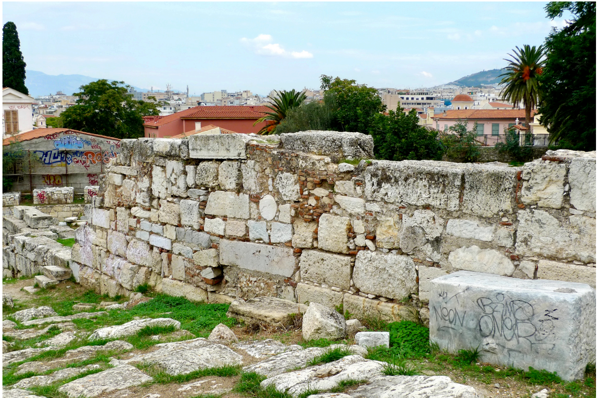
Bild 3. Den efterheruliska muren på östra sidan av gångvägen från Akropolis till Agora. I bakgrunden det moderna Athens centrum.

germanfolk, som under några år var herrar över delar av Grekland, plundrade, mördade och skövlade. De har efterlämnat en del spår av sin förstörelselusta i det arkeologiska materialet i Athen, och, som redan nämnt, efter det året har vi inga uppgifter om statligt avlönade filosofiprofessorer i Athen. Men, tvärtemot vad man ibland har trott, innebar herulernas härjningar inte slutet för Athens guldglans. Ett forskningsprojekt rörande “det efterheruliska Athen” som bedrevs vid Finska institutet i Athen har tydligt visat detta. 13