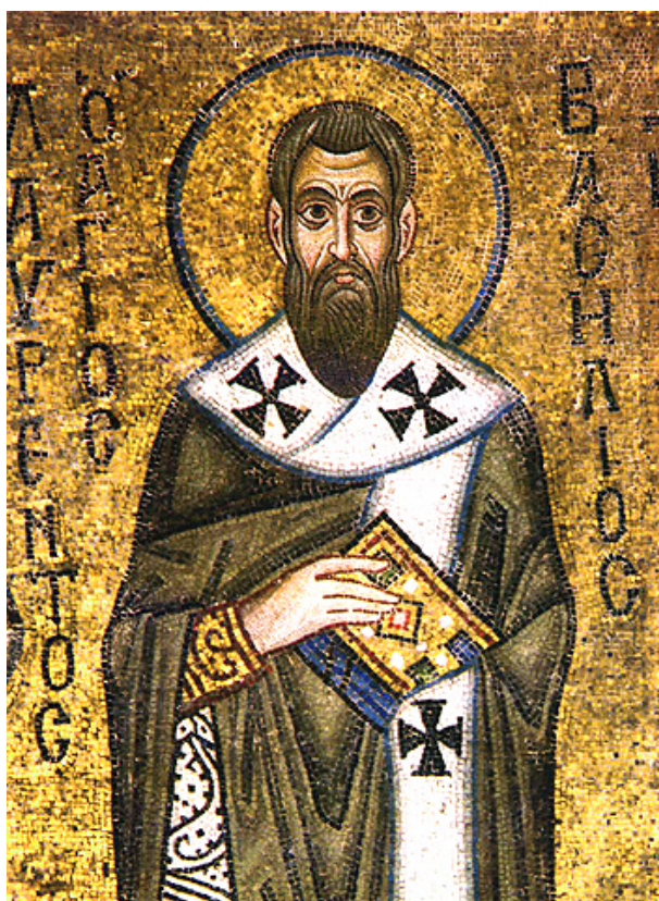
Bild 2. Basileios av Kaisareia. Mosaik från 1000-talet i Sofiakatedralen i Kiev.