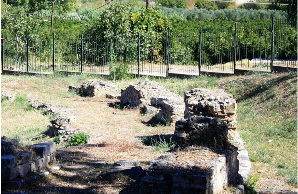
Rester af de murede tilskuerpladser omkring templet (Forfatterens foto, oktober 2017).