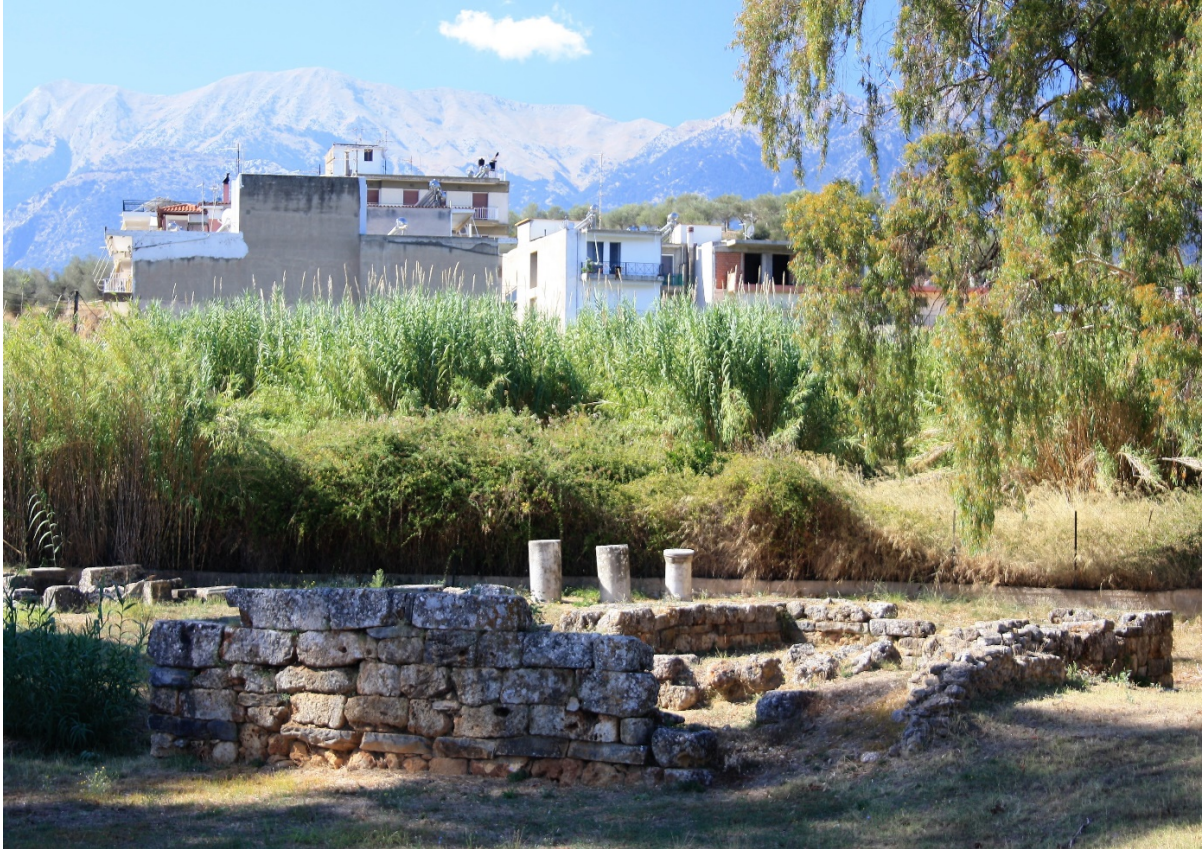
Templet, som det ser ud i dag, set fra syd. (Forfatterens foto, oktober 2017).