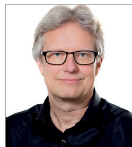
Af Kurt Houlberg, professor ved VIVE

De samlede kommunale nettodriftsudgifter til det specialiserede socialområde er steget fra 52,1 mia. kroner i 2018 til 56,5 mia. kroner i 2022. Stigningen på 4,4 mia. kroner svarer til en stigning på 8,4%. Til sammenligning er de samlede kommunale serviceudgifter i samme periode steget med 4,4%. Udgiftsstigningen