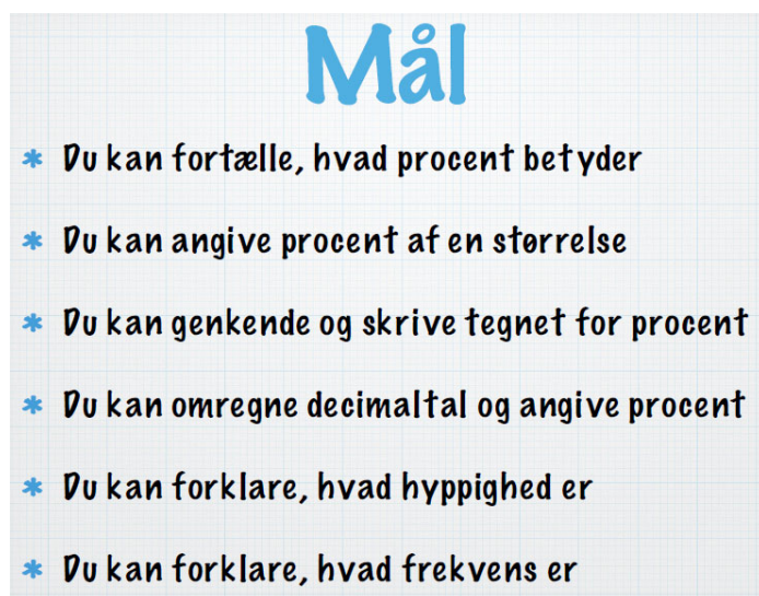
Figur 5 Skærbillede fra lærerens præsentation

I udgangspunktet gør læreren egentlig bare, hvad vi gennem planlægningssamtaler har drøftet skal være centralt i undervisningen. Mine observationer og interviews får mig til at reflektere over målstyret matematikundervisning. De indledende analyser indikerer, at tilgangen ikke er konstruktiv i forhold til, hvad der bør karakterisere målstyret undervisning. Empirien fremkommer med en tydelig indikation af, at synlige læringsmål i klasserummet i sig selv ikke gør noget. Der er her identificeret en nærliggende risiko for, at ritualiseret målstyret undervisning afkobler en central dimension ved målstyret matematikundervisning, nemlig lærerens evne til at være didaktisk reflekteret. Faren for ritualiseret målstyring er en relevant pointe at gøre opmærksom på som en hindring for mange matematiklærere, der forsøger at praktisere en målstyret matematikundervisning. I et interview beskriver læreren, hvordan operationalisering af mål i undervisningen har udviklet sig: