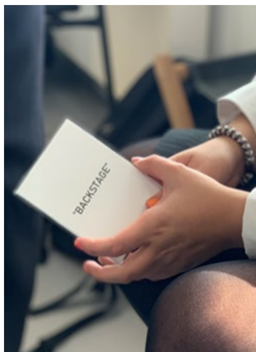
Foto 3. Backstage-designet