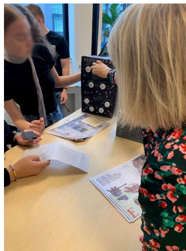
Foto 2. Afprøvning af mundtlighedsmaskiner

Læreruddannerne involverer sig desuden ved at spørge uddybende og opklarende til det, der konstrueres, og de valg, der træffes i processen: "Kan man slukke ved at trykke her?", "Hvad er der hernede?"; "Den her, kan man skrue op og ned for den?", "Har I afprøvet den på nogle af teksterne?" (video). Læreruddannerne spørger ligeledes ind til de studerendes forståelse af danskfaglige begreber i relation til