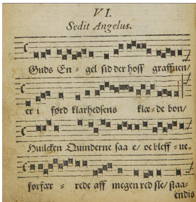
Figur 4. Den danske oversættelse fra Thomissøns salmebog (Hans Thomissøn, Den danske Psalmebog , København: Lorenz Benedict, 1569, fol. 87v).