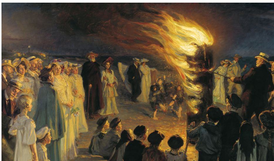
P.S. Krøyer, Sankt Hansblus på Skagen strand , 1906. Deponeret på Skagens Kunstmuseer. Tilhører bankassistent Henry Styhrs Mindelegat. Beskåret.

”udenlandsk”, ”fremmed” eller ”fra en anden egn” ifølge Ordbog over det danske Sprog . Det er muligt, at Drachmann indirekte også sigtede til den europæiske radikalisme, som jo ikke nødvendigvis kom fra udlandet, men fra den brandesianske bevægelse i København. Uanset hvad ordet præcist dækker over, betoner Drachmann danskernes forsvar, som med bål ”paa Fædrenes Gravhøje” vil barrikadere sig og holde fjenden på afstand. Her bliver gravhøjene et nationalromantisk symbol på de stolte forfædre, hvis historie landet bygger på. Bålet er et stærkt samlingspunkt for befolkningen, og Drachmanns effektive brug af ”vi” indgyder sammenhold og fællesskabsfølelse i kampen for fred , som oven i købet er særligt fremhævet, både i 1885-udgaven af skuespillet samt den reviderede og opførte version fra 1887.