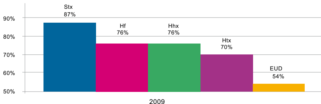
Tabel 2: Fuldførelsesprocent på ungdomsuddannelserne