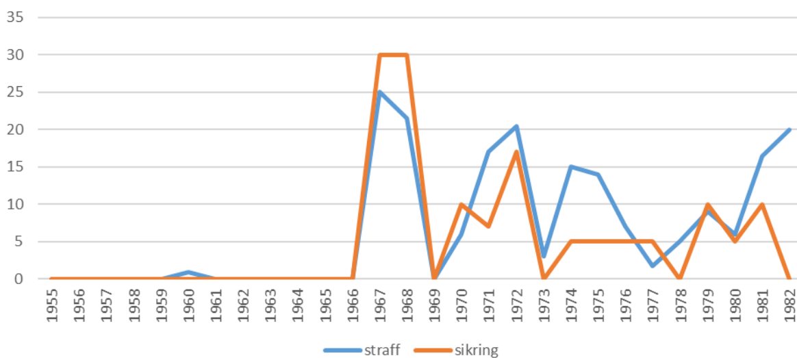
Figur 2 B: Antall år med fengsel og sikring vist samlet år for år (N=36). Saker som har medført henleggelse eller straffritak vil ikke gi utslag på grafen, år uten saker vises heller ikke.