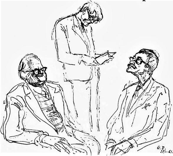
Becker taler efter ved prisuddelingen i 1961. De to tilhørere er Tom Kristensen og den norske digter Arnulf Øverland. Tegning af Hans Bendix på forsiden af Politiken, 29.11.1961.