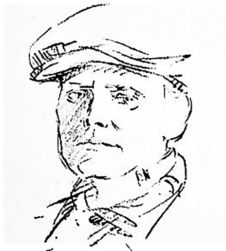
I lang tid var "kasketbilledet" det eneste tilgængelige. Her forvandet til stregtegning af Berlingske Tidendes Otto C.