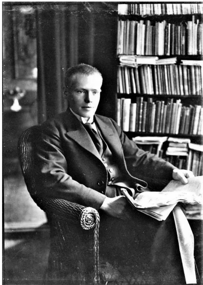
Becker i hjemmet 1919. Ikke den ubehjælpssomme Kai.