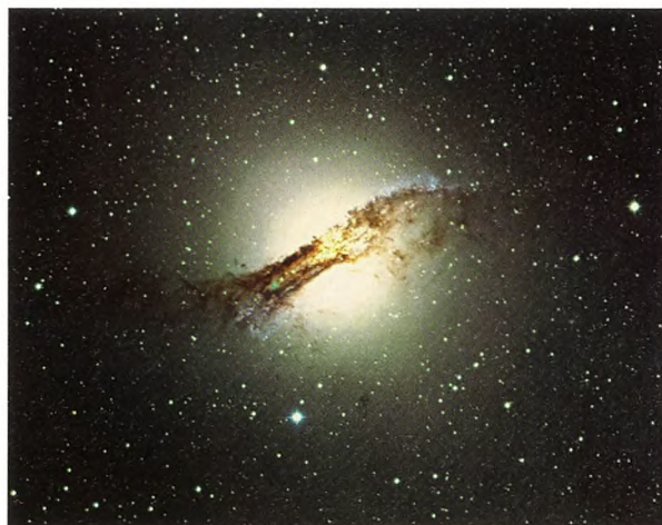
Figur 3. Den aktive galakse Centaurus A.

Der kendes faktisk kun ganske få objekter inden for en afstand på 60 mio. lysår som formentlig er i stand til at producere stråling med så høj energi. Et af dem er den aktive galakse Centaurus A (figur 3).