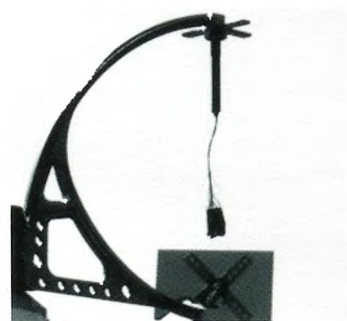
Figur 2. Vindmåler udviklet af Aarhus Universitet.

Phoenix er landet i et fladt område nær Mars' nordpol. Fravalget af et mere kuperet terræn med klipper eller lignende er bevidst, da man ønskede en problemfri landing. Nordpolen på Mars er desuden utrolig interessant, da der findes store mængder af vandis og vand er fundamentalt for liv som vi kender det. Ved at studere isens historie håber man at lære mere om Mars' klimaændringer. Bare fire dage senere havde man klare indikationer af, at der virkelig var is. Med kameraet på Phoenix' robotarm opdagede forskerne, et hvidt materiale under sonden. Det formodes at være et lag is, der blev blotlagt under landingen, hvor raketmotorerne har blæst støv væk. Forskerne vil prøve at studere, hvordan det hvide lag reflekterer under forskellige belysningsforhold, så de kan bekræfte om det virkelig er is.