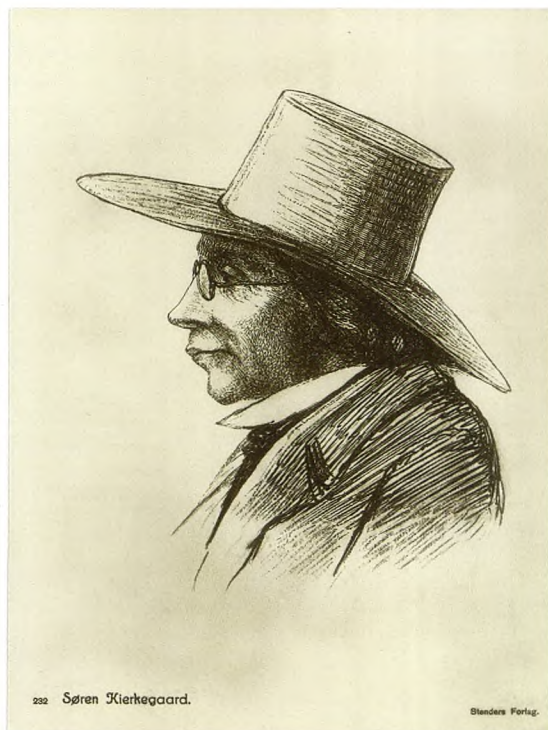
Figur 2. Portræt af Søren Kierkegaard.

menneskets forhold til sig selv, andre mennesker og verden.