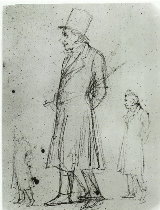
Figur 3. Tegning af Søren Kierkegaard udført af Wilhelm Marstrand ca. 1870.

vores familie, venner og kolleger, men vi har ansvar for at elske alle mennesker, dvs. mennesker, vi ikke kender, og mennesker, vi ikke ser, og ikke mindst mennesker, som vi betragter som vores fjender. Der gives ingen rationelle eller fornuftige argumenter for denne kristne kærlighedsetik eller for kærlighedens opbyggelige magt. Det betyder for Kierkegaard, at vi har brug for tro for at kunne forstå, leve efter og med denne kærligheds etik. Uden tro på kærligheden er etikken med andre ord magtesløs.