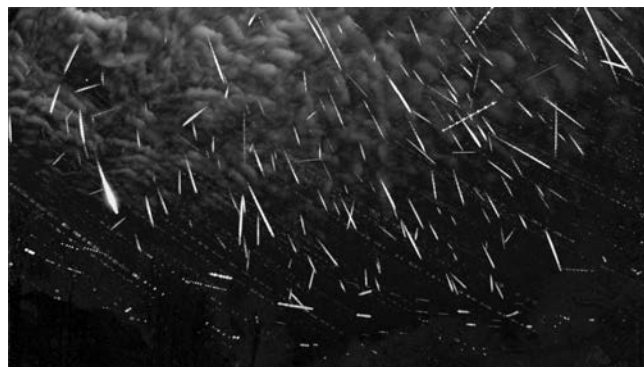
Figur 3. Summen af DK0001-observationer fra den kun delvis klare nat mellem 12. og 13. december 2022. Kameraet peger i en fast opstilling mod vestsydvest. Stjernefeltet har bevæget sig fra øverste venstre hjørne mod det nederste højre. Efter automatisk frasortering af spor fra stjerner, satellitter, fly og måske ugler og flagermus, tilbagestår 187 meteorer, af hvilke de fleste er geminider, se næste figur.

Med seks sådanne kameraer kan hele himlen dækkes, og det sker flere steder. Noget lignende gør det tyske AllSky7netværk [5] og det amerikanske CAMS [6].