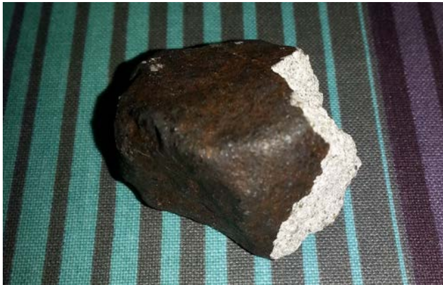
Figur 7. Finderen af det første fragment af Ejby meteoritten tog dette foto for at overbevise Henning Haack (meteorit-ansvarlig på Geologisk Museum), om at hun nok havde fundet noget interessant. Det var ikke svært ...

“Videncenter for Citizen Science” [14] ved Syddansk Universitet (Odense campus) har siden 2019 specialiseret sig i facilitering, udbud, træning og udvikling af borgerdrevne videnskabsprojekter spændende over en bred vifte af fagområder, det være sig fra litteratur- og naturvidenskab til social- og sundhedsvidenskab. Formålet er at bygge bro mellem de akademiske