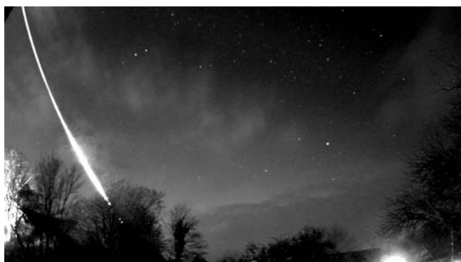
Figur 5. Ildkugle observeret 1. december 2022, 17:36 dansk tid, delvis gennem skyer. Billedet er summen af 512 enkeltbilleder taget med frekvensen 25 per/sekund. Tydeligvis var fænomenet godt i gang, da det kom til syne i 36 graders højde i billedets overkant; det forsvandt i 5,8 graders højde bag efeu-bevoksede træer. Sporets krumme form skyldes optikkens fortegnings. De klareste stjerner er Altair – i stjernebilledet Ørnen – og Rasalhague i Slangebæreren.

Regulære ildkugler, observeret med GMN, har potentialet til hurtig lokalisering og dermed opsamling af nyfaldne meteoritter, hvilket er vigtigt for laboratoriemåling af hurtigt henfaldende radionukleider. Hvis flere stationer har set samme ildkugle, kan banen gennem atmosfæren bestemmes til omkring 20 meters nøjagtighed. Hvad det eventuelle nedslagspunkt angår, vil stykkernes geometriske form (deres ukendte afvigelse fra symmetri) og vindforholdene i de nedre højder, hvor fragmenterne ikke længere er lysende, påvirke flugten. Hvad man kan tage i betragtning, beregningsmæssigt, er de typiske glimt, som ofte udsendes under flugtens seneste tredjedel: De vides at modsvares af fragmenters separation fra hovedmassen. Det australske fald+fund Murrili er et glimrende eksempel [7].