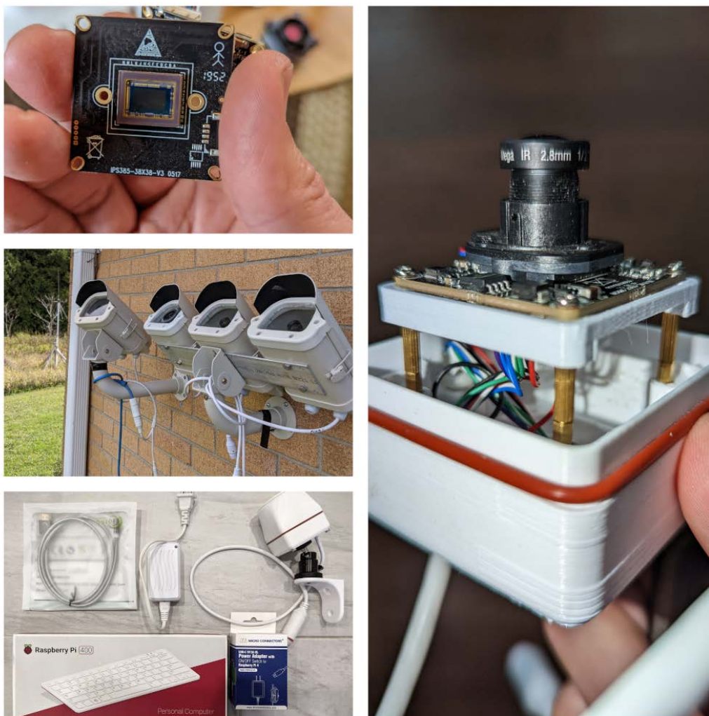
Figur 8. Varianter af GMN kameraet, som man kan installere derhjemme – i haven, på taget eller balkonen.