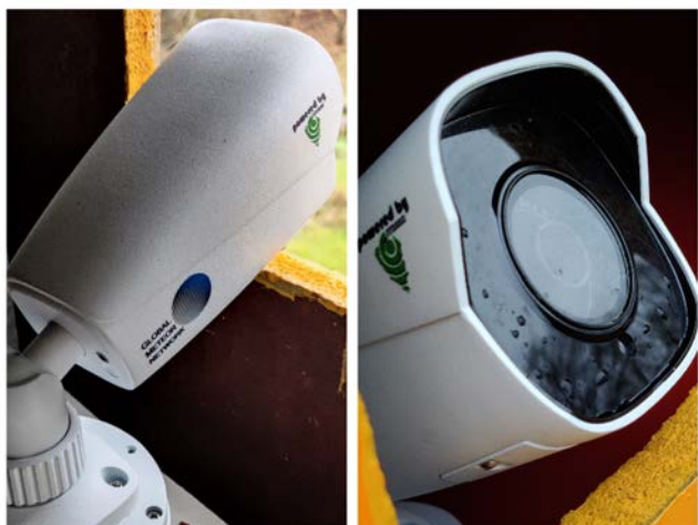
Figur 2. DK0001 titter ud af et afblændet vindue. Optikkens frie åbning, som kun anes, er ca. 3,8 millimeter.

åbningsforhold F0,95 og brændvidde f = 3,6 millimeter, hvilket giver et synsfelt på omkring 45 \times 88 grader.