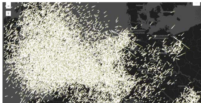
Figur 1. GMN-detektionerne over Nordvesteuropa fra august 2022. Langt de fleste stjernesked er perseider – støv fra kometen 109P/Swift-Tuttle – en komet som ses med ca. 133 års mellemrum og hvis seneste passage nær Solen var i december 1992. Frigivet under CC-BY 4.0 licens.

radianten flyttede sig 0,74 grad fra dag til dag, og hvor stor tætheden var: 4.0 \times 10^{-13} \text{ g km}^{-3} [2].