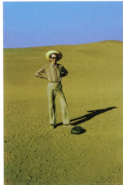
Figur 2. En synlig glad finder, 8. januar 1988. Meteoritten vejer 32.6 kilogram.

Frankfurt am Main, hvor den blev skåret igennem og poleret. De to endestykker, samt to tynde skiver, blev returneret til København. Som antydning ligger den ene del nu i Garching, medens den anden fortsat er udstillet på Geologisk Museum. Det er en del af det store fund ved “Vaca Muerta” i Chile, af typen mesosiderit. Herom har jeg skrevet en hel bog [1].