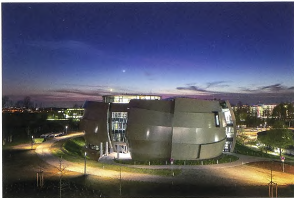
Figur 1. ESO Supernova Planetariet.

Hvis turen går til Bayern, så læg vejen forbi Münchens nordlige udkant. Her har det Europæiske Sydobservatorium, ESO, netop indviet et high-tech planetarium, kaldet Supernova. Det er doneret af Klaus Tschira Foundation, hvis afdøde stifter var en stor ven af naturvidenskaben. Man kommer lettest dertil med undergrundsbanen, og der er kun tre minutters gang fra station “Garching-Forschungszentrum”. Adgangen er gratis.