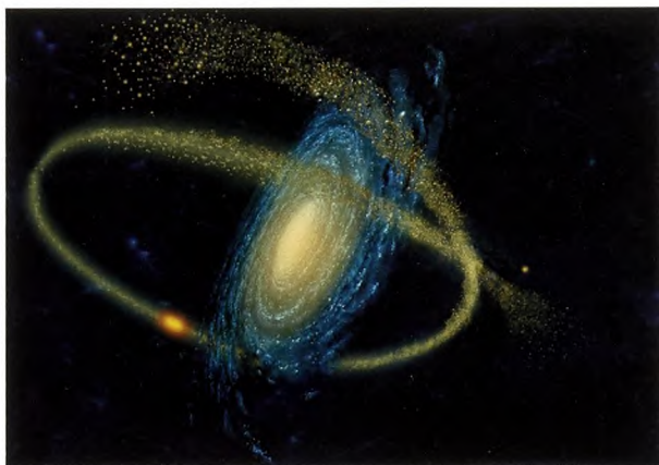
Figur 2. Illustration af en strøm af stjerner der omslutter en hel spiralgalakse. Disse stjerner undslipper de kuglehobe, som de befinder sig i, fordi tidevandskræfter fra galaksens samlede massefordeling "hiver" i stjernerne. Disse strømme af stjerner er som regel lige lange i både deres ledende (fremadrettede) og bagudrettede strømme (se længdesymmetrien i længden af strømmene som set fra den orange kuglehob) [Jon Lomberg].

I vores egen galakse kan vi dog få en ide om hvordan massen er fordelt i hele galaksen ved at studere, hvordan stjerner bliver hevet ud af kuglehobe (klumper af stjerner) mens de bevæger sig rundt om Mælkevejen [1]. Når disse stjerner bevæger sig rundt i baner om vores galakse, vil nogle af stjernerne slippe ud af kuglehobene på grund af tidevandskræfter fra hele Mælkevejens massefordeling (se et eksempel i figur 2). Som når Månens tidevandskræfter påvirker havene på Jorden vil det punkt der er tættest på Månen føle en lidt større tyngdekraft end det punkt på Jorden der er længst fra Månen, og der er derfor højvande på begge sider samtidigt. Forestil dig så at denne kraft var så stor at oceanerne kunne blive hevet af Jorden. Dette ville ske fra begge sider. Dette er analogt til, hvad der sker for stjerner i kuglehobene. Nogle stjerner føler en kraftpåvirkning fra Mælkevejen, der er større end kraften fra deres egen hob af stjerner. De kan dermed undslippe deres hob. Dette vil skabe to lange symmetriske strømme af stjerner der danner en ledende og en bagudrettet strøm af stjerner (se figur 2). Stjernerne i strømmene har en lidt anden energi end stjernerne i selve kuglehoben. De stjerner der er i den ledende arm har en lavere energi, og de stjerner der er i den bagudrettede arm har en lidt højere energi, og disse stjerner vil komme længere foran og bagved selve hoben som tiden går.