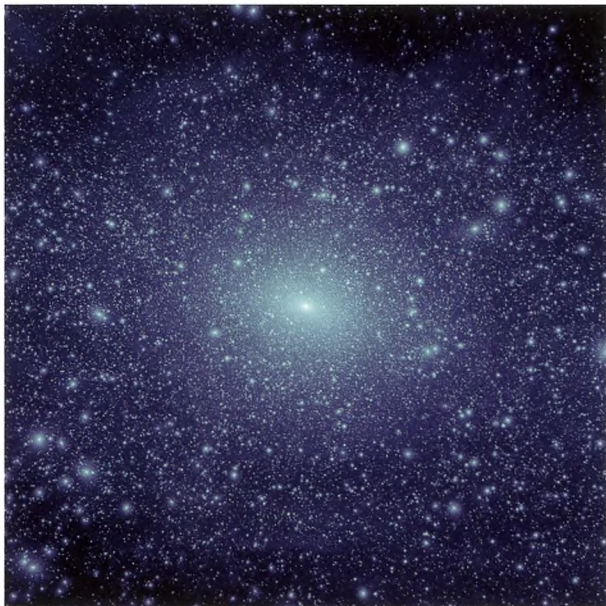
Figur 4. Udsnit af en computersimulering af hvordan mørkt stof fordeler sig rundt om en galakse, der vejer det samme som vores egen galakse. Man tror man kan finde disse klumper af mørkt stof, da de i princippet kan slå hul i stjernestrømme [10].

vil afhænge af, hvornår hullet dannedes, hvor meget bjælken vejer, hvor hurtigt bjælken bevæger sig, og hvor hurtigt Palomar 5-strømmen bevæger sig. Vi kan altså indirekte studere den galaktiske bjælke i vores egen galakse ved at studere, hvordan bjælken påvirker Palomar 5-stjernestrømmenes udsende. Ud fra beregningerne i [6] lader det til, at Mælkevejen har en enormt hurtigt roterende bjælke (den lader til at bevæge sig en gang rundt om sig selv på kun 100 millioner år, hvorimod Solen bruger ca. 220 millioner år på at nå en gang rundt i galaksen). Dette er interessant, da andre forskere har forudsagt at bjælken vil sænke farten under sin levetid – måske har vi altså en relativt nyligt formet bjælke i vores galakse?