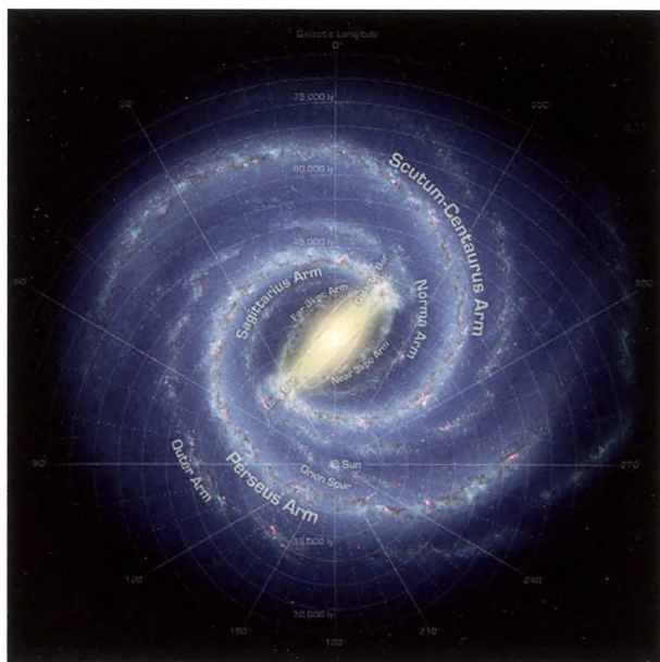
Figur 1. Illustration af hvordan vi tror Mælkevejen ser ud fra oven. Spiralarmene ses i stjerneskiven, og den galaktiske bjælke er illustreret som den gule klump i centrum af vores galakse. Stjerneskiven er ca. 100.000 lysår fra den ene ende til den anden [NASA].

Galakser er enorme samlinger af stjerner og gas forbundet i en spindelvævsagtig struktur af mørkt stof, der strækker sig over hele vores Univers. Ifølge vores nuværende forståelse, har galakser opbygget deres masse ved at kolliderer med og opsluge mindre galakser i løbet af Universets levetid. Heldigvis efterlader disse kollisioner stjernestrukturer og stjernestrømme (stellar streams), der overlever i flere milliarder år. Ud fra vores forståelse af tyngdekraften tillader fordelingen og bevægelsen af disse stjernestrukturer, at astrofysikere kan arbejde baglæns i tiden og studere, hvor stjernerne engang var placeret, hvordan galakser har opbygget deres masse og undersøge, hvad der har påvirket stjernerne undervejs [1].