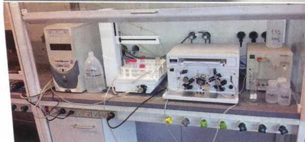
Figur 6: Knogleprøve med spongøst væv af Tycho Brahe og CV-AAS apparatur.