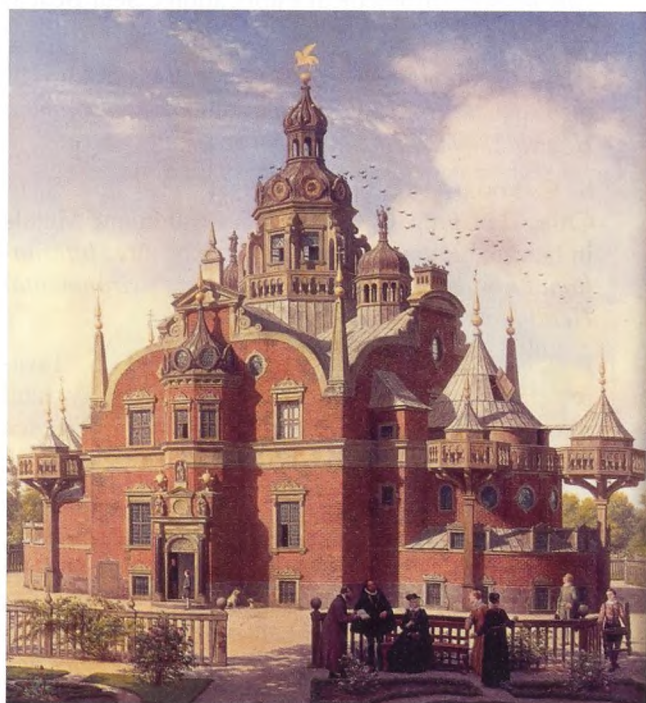
Figur 5: Observatoriet Uranienborg er et af Tycho Brahes observatorier på øen Hven i Øresund, opført omkring 1580.

sølv. Faktisk er der heller ikke noget bemærkelsesværdigt ved koncentrationerne af nogen af de andre grundstoffer. Det spændende ligger i variationerne af koncentrationerne med tiden.