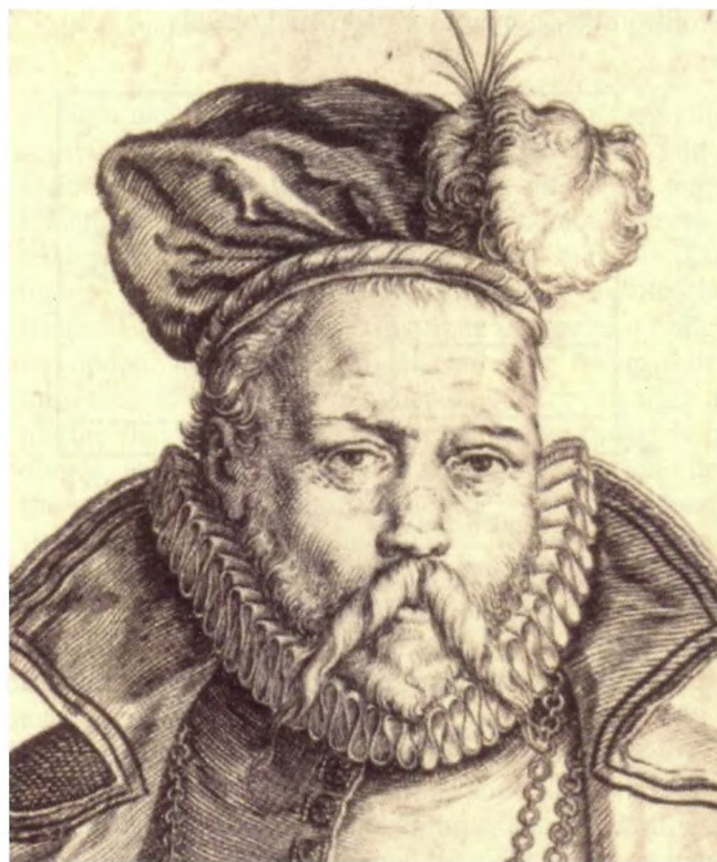
Figur 1: Tycho Brahe (1546-1601)