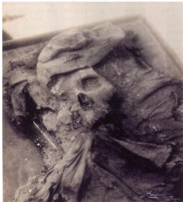
Figur 2: Tycho Brahes jordiske rester som de så ud ved udgravningen i 1901.

Således fortalt strækker Tychos sygehistorie 11 dage; med alle de konsekvenser dette har for de mulige diagnoser. Som det kan ses i figur 3, er der for nyligt publiceret nye målinger på Tycho Brahes jordiske rester, som på afgørende vis ændrer på dette billede.