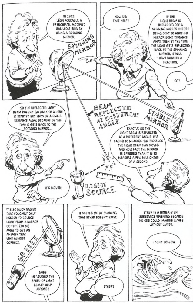
Figur 3. Eksempel fra tegneserien "Journey by Starlight". Einstein er i dialog med sin følgesvend og forklarer et eksperiment, der kan hjælpe med at beregne lysets hastighed. Det opstilles på tværs af hele siden og gør det mere dynamisk at læse, fordi lysstrålerne bevæger sig på tværs af panelerne. Samtidig giver dette eksperiment Einstein mulighed for at begynde en forklaring af teorien om æter som det medium, bølger bevæger sig igennem ligesom de gør i vand. På den måde kædes en masse af fysikkens opdagelser sammen i en fortælling, der gør det nemmere at forstå teorierne bag ved. Fra [6].

I biografierne om store videnskabsmænd optager deres videnskabelige opdagelser ofte en stor del af handlingen, men deres liv som fortælling fylder også meget. Det sted, hvor videnskab og tegneserier virkelig møder hinanden er i det, man kan kalde informationstegneserier, faglitterære tegneserier eller uddannelsestegneserier [5]. Det er ofte tegneserier, der bevidst forsøger at uddanne sin læser og bruger tegneserien til at gøre det sjovere, nemmere og mere interessant at lære komplekse teorier og forstå videnskabelige sammenhænge. Der findes et utal af "graphic guides", der efter sigende skal gøre det nemmere at forstå fysik, men de er ikke nødvendigvis gode tegneserier, ej heller gode fysikbøger. Bare fordi der er sjove tegninger til, betyder det ikke, at fysikken bag ved er rigtig eller at det er nemmere at lære. Ofte består disse guides af store klumper af tekst med et enkelt billede til som ikke nødvendigvis gør forståelsen nemmere, så tegningerne er mere med for at underholde.