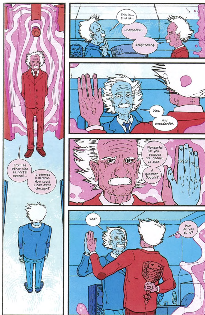
Figur 1. Eksempel fra tegneserien "The Manhattan project". Einstein opdager en portal til en parallelverden med hjælp fra Feynman. Her møder han en anden version af sig selv, der ikke er helt så venlig, som man skulle tro. Farverne understøtter denne pointe, fordi vi tidligere i serien har mødt Oppenheimer (blå) og hans onde tvilling (rød). Fra [1].

I "The Manhattan Project" (se figur 1) bruger tegneserieskaberne det berømte atombombeprojekt til at skabe nye fantastiske historier, der har rod i virkelighedens verden og bruger kendte fysikere som hovedpersoner.