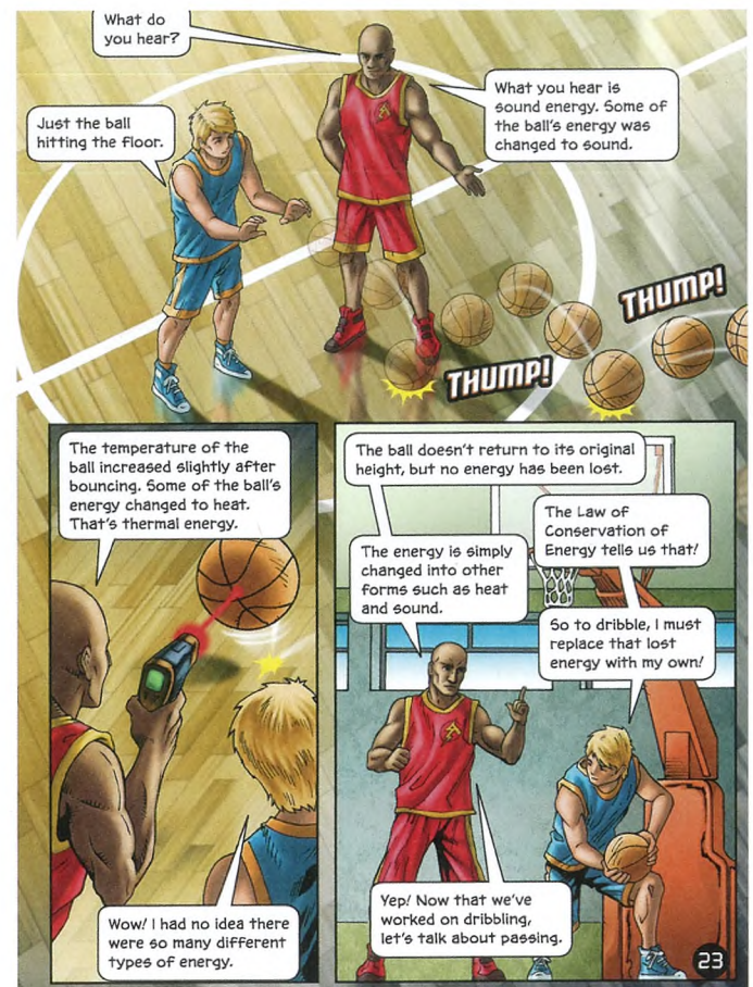
Figur 4. Eksempel fra tegneserien "Max Axiom". I serien med Max Axiom Superscientist er præmissen, at børn og unge har svært ved at forholde sig til fysik uden en konkret sammenhæng. I dette eksempel bruger MaxAxiom basketball til at forklare en række elementære fysiske love for den fysikudfordrede basketballspiller. Ved at visualisere sine pointer har Max Axiom nemmere ved at forklare dem og læseren bliver engageret i fysikken, fordi den foregår som del af et narrativ. Fra [8].

Den dialogiske form fungerer godt, for så kan Einstein og figuren diskutere problemer og den navnløse figur kan stille spørgsmål, som læseren også godt kunne tænke sig svar på, mens de susser rundt i Universet.