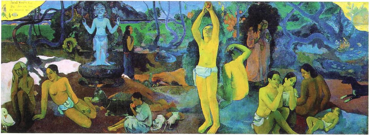
Figur 4. Både fysikere som Erwin Schrödinger og kunstnere som Paul Gauguin har i deres arbejde været drevet af eksistentielle spørgsmål. Her er det Gauguin's maleri "Hvor kommer vi fra, hvad er vi, og hvor skal vi hen?" fra 1898.

En fremhævelse af æstetikken i undervisningen betyder selvfølgelig ikke, at nytteaspektet, i dagligdagen eller for elevens og samfundets fremtid, skal ignoreres 7 . I stedet er der snarere brug for en afbalancering mellem det æstetiske og det nyttige. Og for så vidt at æstetik kan øge motivationen for eleverne, så behøver der ikke være nogen konflikt mellem egenværdi og nytteværdi af undervisningen. Men, som allerede antydnet, synes specielt den økonomiske nyttetænkning at være altoverskyggende i den nuværende uddannelsespolitiske situation. Fx er det næppe forkert at forbinde PISA-feberen med ideen om, at en vellykket integration på arbejdsmarkedet er det grundlæggende mål for uddannelse. En sådan vision udgør en underminering af oplevelse og fordybelse i læringssituationen som mål i sig selv. Måske har ingen bedre udtrykt forholdet mellem nytte og æstetik i en pædagogisk sammenhæng end professor Keating i filmen "Dead Poets Society". Her er, hvad han siger i en scene, hvor eleverne bliver forklaret, hvorfor de skal lære om poesi, når det nu ikke fremmer karrieremulighederne: