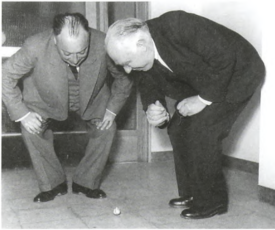
Figur 2. Leg kan være en vigtig motivation i fysik. Her leger Wolfgang Pauli og Niels Bohr med "tippetoppen" i Lund 1951.

Hvad angår glæden ved indsigt i fysik, så er denne fint beskrevet i Victor Weisskopfs selvbiografi [10]. Han omtaler bl.a. denne glæde i forbindelse med hans egen begyndende dybe forståelse af kvantemekanikken, som for ham var som "the opening of a new world", og mener at han bedst kan karakterisere indsigtsglæden som en "feeling of aesthetic pleasure" (s. 37). Denne karakteristik er uddybet allerede på første side af bogen: