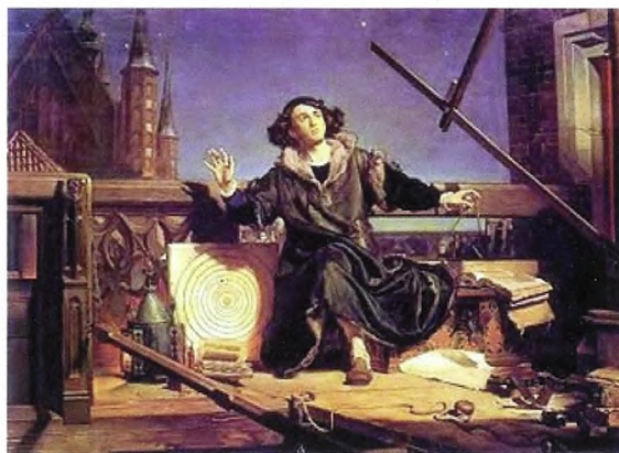
Figur 1. Kopernikus' model for Solsystemet (som ses ved siden af astronomen i dette billede af Jan Matejko fra 1872) var ikke i bedre overensstemmelse med data end Ptolemeus'. Til gengæld mente Kopernikus at hans model bedre levede op til æstetiske krav om fx planeternes uniforme cirkelbevægelser, se [1].

“Copernicus’ radical cosmology came forth not from new observations but from insight. It was, like Einstein’s revolution four centuries later, motivated by the passionate search for symmetries and an aesthetic structure of the universe.”