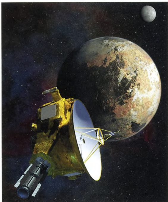
Figur 3. Rejser i fysikundervisningen kan fx gå tilbage i tiden eller ud i rummet. Her en illustration af New Horizon sonden der nærmer sig Pluto, som blev "besøgt" af DR-radioprogrammet Videnskabens Verden i 2015.

Som tidligere nævnt kan forundring også sættes i forbindelse med det sublime og med fysikkens grænser. Men da den daglige undervisning næppe hver gang kan gå til grænsen, er det praktisk, at der også er andre aspekter af det sublime, der kan være relevante for æstetiske oplevelser. Den formodede ophavsmand til et af de første skrifter om det sublime – den græske retoriker Longinos der levede i det tredje århundrede – forbandt bl.a. begrebet med det at holde tale. Han forklarede [27]: "The effect of elevated language upon an audience is not persuasion but transport". Altså at det ophøjede eller sublime ikke overtaler os, men snarere løfter os og tager os med et andet sted hen. Sådanne transportmuligheder er der mange af i undervisningen, specielt hvis man medtænker forestillede rejser i tid og rum 6 .