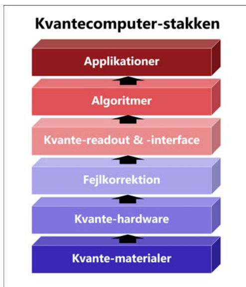
Figur 4. Kvantecomputerstakken.