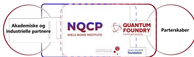
Figur 2. NQCP og Quantum Foundry Copenhagen er to forskellige enheder, som arbejder i tæt partnerskab.

som karakteriserer universitetsprogrammer med den nødvendige beskyttelse af forretningshemmeligheder, som gør en virksomhed konkurrencedygtig.