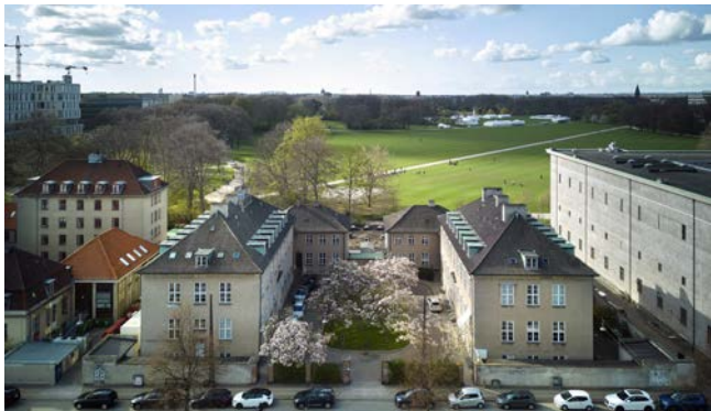
Figur 3. NQCP er rykket ind i de historiske bygninger på Blegdamsvej på København.

Men det danske fokus på kvant er ikke kun historisk. Der foregår løbende banebrydende forskning inden for kvantefeltet i Danmark, og som noget nyt kommer der nu hele tiden flere nytænkende danske kvantestartups til. Med NQCP-programmet håber vi også at bidrage til at løfte hele økosystemet i og omkring København.