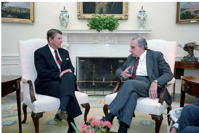
Figur 3. Edward Teller møder Præsident Reagan i det ovale værelse den 14. september 1982.