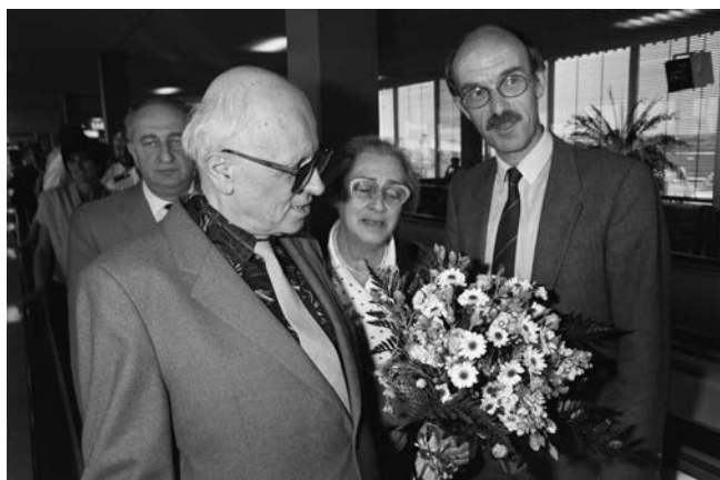
Figur 4. Andrej Sakharov og Jelena Bonner modtages med blomster i Amsterdams Lufthavn den 15. juni 1989.

Novgorod] nogle hundrede kilometer øst for Moskva. Et eksil, der varede frem til 1986, hvor Sovjetunionens nyvalgte ministerpræsident Mikhail Gorbatsjov endelig gav Sakharov lov til at komme tilbage til Moskva.