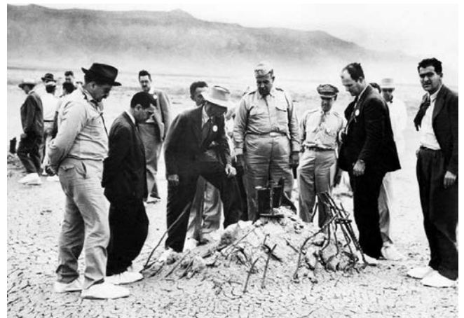
Figur 2. Fysiker Robert Oppenheimer og General Leslie Groves m.fl. ved resterne af tårnet, hvor Trinity, verdens første atomprøvesprængning, fandt sted om morgenen den 16. juli 1945.

en særlig etos, der gav håb om fred og sameksistens. Det lignede på nogle punkter den idealistiske internationalisme, der kom til udtryk i Niels Bohrs åbne brev til FN i juni 1950. Bohrs udgangspunkt var dog et andet. Hans internationalisme var et resultat af de erfaringer, han havde fået i sine bestræbelser på at gøre sit institut på Blegdamsvej i København til et verdenscenter for atom- og kernefysikere fra begge sider af de gamle frontlinjer i mellemkrigstidens splittede Europa. For Bohr krævede videnskabelig internationalisme omfattende åbenhed og en vedvarende diplomatisk indsats drevet af forskerne selv [2].