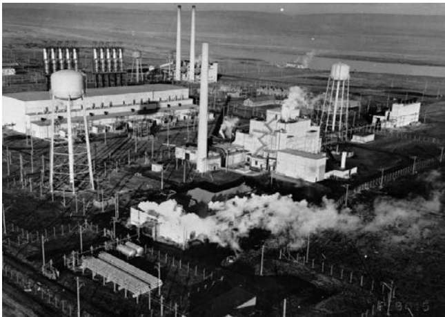
Figur 1. Manhattan-projektet var Big Science. På billedet ses en del af det gigantiske Hanfordanlæg ved Columbia River i Washington State. Det var i disse reaktorer, der blev produceret plutonium til bl.a. Trinity-bomben og bomben over Nagasaki.

Manhattanprojektet og det efterfølgende kernevåbenkapløb mellem USA og Sovjetunionen skabte en helt ny situation for videnskaben og i særdeleshed for mange fysikere. De kom til at bevæge sig i en verden af store organisationer med interdisciplinær, projektorienteret forskning baseret på arbejde i store teams. Modsat den klassiske akademiske forskning var det en organisatorisk virkelighed med nærmest ubegrænsede ressourcer, men med modsvarende stort tidspres. De fik også meget tættere forbindelser til kommercielle, militære og politiske magtcirkler. Kernefysik og atomteknologi var blevet big science , en ramme og form for videnskab, som videnskabshistorikeren Jon Agar karakteriserer med de fem M'er: Money, Machines, Men, Military, Media. Store budgetter, gigantiske instrumenter og maskiner, tusindvis af mennesker organiseret hierarkisk, massiv militærbevågenhed og omfattende mediestrategier var centrale komponenter i de ændrede vilkår.