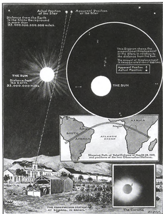
Figur 1. Original illustration af den første måling af gravitationsafbøjningen af lyset fra en stjerne ved den totale solformørkelse i 1919.

hvor G er Newtons gravitationskonstant og c er lysets hastighed. Den første måling af denne afbøjning blev udført af Sir Arthur Eddington i 1919. Ved en total solformørkelse kunne han måle en tilsyneladende positionsændring af baggrundsstjerner tæt ved solens overflade, som illustreret i figur 1. Afbøjningen af lys som følge af tyngdekraften kaldes gravitationslinseeffekten .