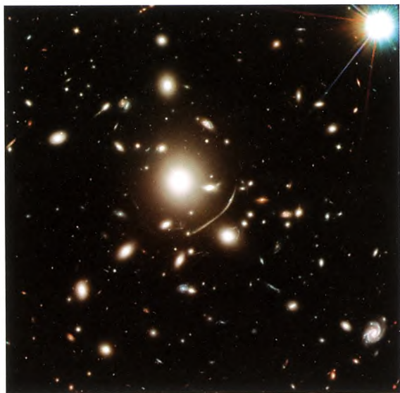
Figur 2. Billede fra Hubble Rumteleskopet af galaksehoben Abell 383. Omkring den store centrale hvid-gule galakse kan man se andre galakser der har den samme karakteristiske farve. Galakserne befinder sig i samme afstand fra os og er en del af den tunge galaksehob. På billedet ser man også galakser med forskellige farver, og nogle er udstrakt i kæmpebuer som et synligt tegn på gravitationslinseeffekten. Disse linsede galakser ligger meget længere væk end galaksehoben, og nogle af galakserne kan endda vise sig at være nogle af de allerførste galakser, der blev dannet i Universet.

Galaksehobe fungerer som effektive gravitationslinser (for fjerne bagvedliggende galakser), fordi de er meget tunge. I 1990'erne kom der fart på udforskningen af gravitationslinser, som kræver observationer fra store teleskoper og instrumenter, som benytter sig af lysfølsomme chips. Nu til dags benytter astronomer de allerstørste teleskoper fra Jorden til at måle hastighederne af galakserne i en hob, samt superskarpe billeder fra Hubble Rumteleskopet til at se detaljer i de fjerne gravitationelt linsede galakser, som illustreret i figur 2.