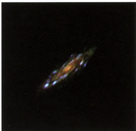
Figur 4. Det øverste billede viser et billede af en galakse, der har gennemgået gravitationel lensning. Det nederste billede viser hvordan galaksen ville se ud, hvis den ikke var linset. Detaljerigheden i billedet er langt større end i andre billeder af fjerne galakser.