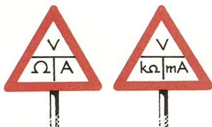
Fig. 34. En ny og nyttig form for Ohms lov! Læg mærke til skiltet til højre.

I folkeskolen præsenteres Ohms lov således: