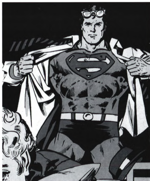
Figur 2. Superman smider skjorten.

Der er også en karakteristisk rollefordeling ved forelæsningen – mellem dem som er til stede med henblik på at lære noget bestemt og veldefineret (de studerende) og den (forelæseren), som er der for at hjælpe dem med at lære dette. Der ligger eksempelvis en fælles forventning om at det er underviseren, der definerer problemet, at han ligger inde med den rigtige måde at løse det på og at han i sidste ende har ansvaret for at det bliver løst.