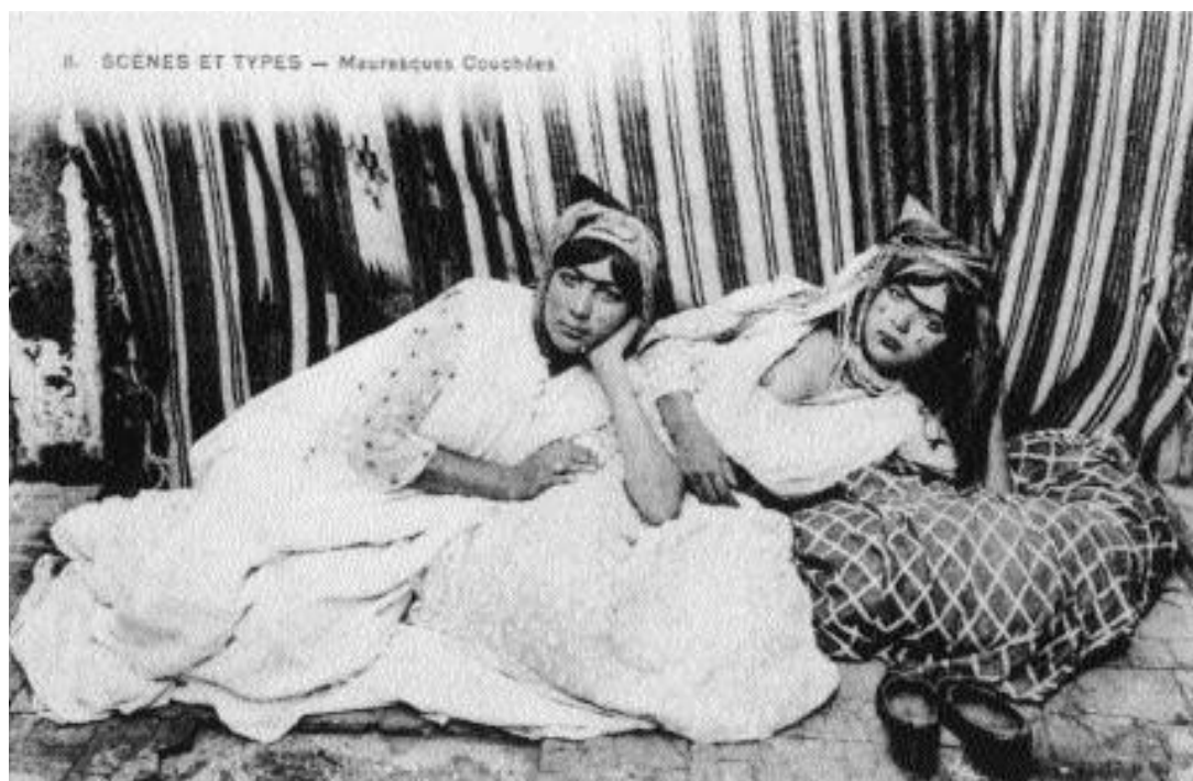
Postkort fra Algeriet.